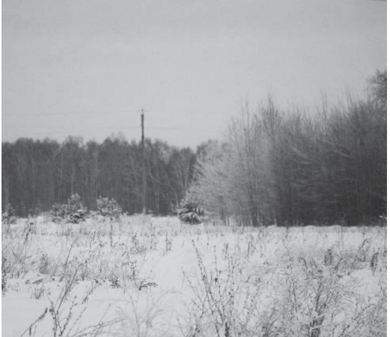
* Зимний покой леса.

Яйца под заказ (домашние). Обр.: т. 8 9068214686.