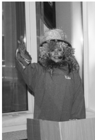
* В тематический год ждём интересные постановки театралов.