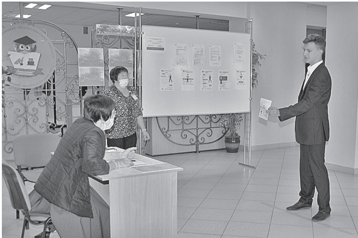
Единый госэкзамен проходит с соблюдением требований безопасности.