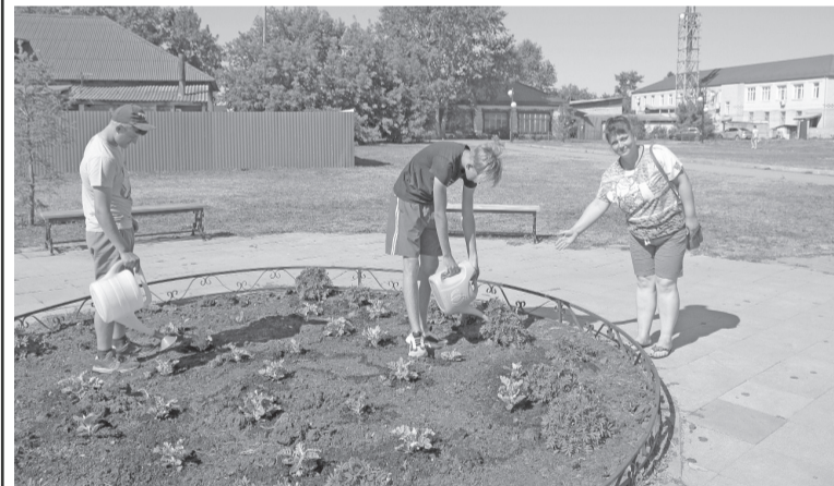
Школьники ухаживают за растениями на клумбах райцентра.

Анастасия ГАЦАЕВА