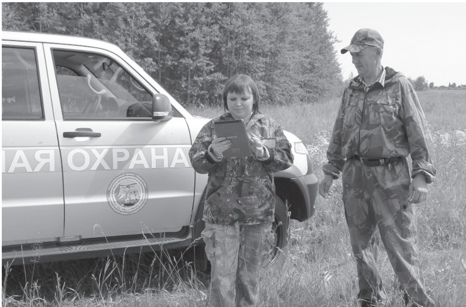
Сотрудники ответственных ведомств ведут патрулирование лесных массивов.