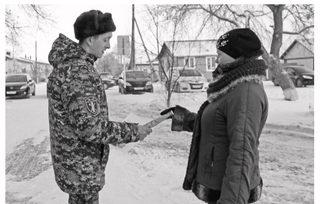
Буклеты Росгвардии содержат советы по сбережению имущества и здоровья.

Проходим раздавали буклеты о безопасности жизнедеятельности, об услугах по охране объектов и имущества граждан, оказании государственных услуг в области оборота оружия. Также желающие получили контактные данные Управления Росгвардии по Тюменской области и