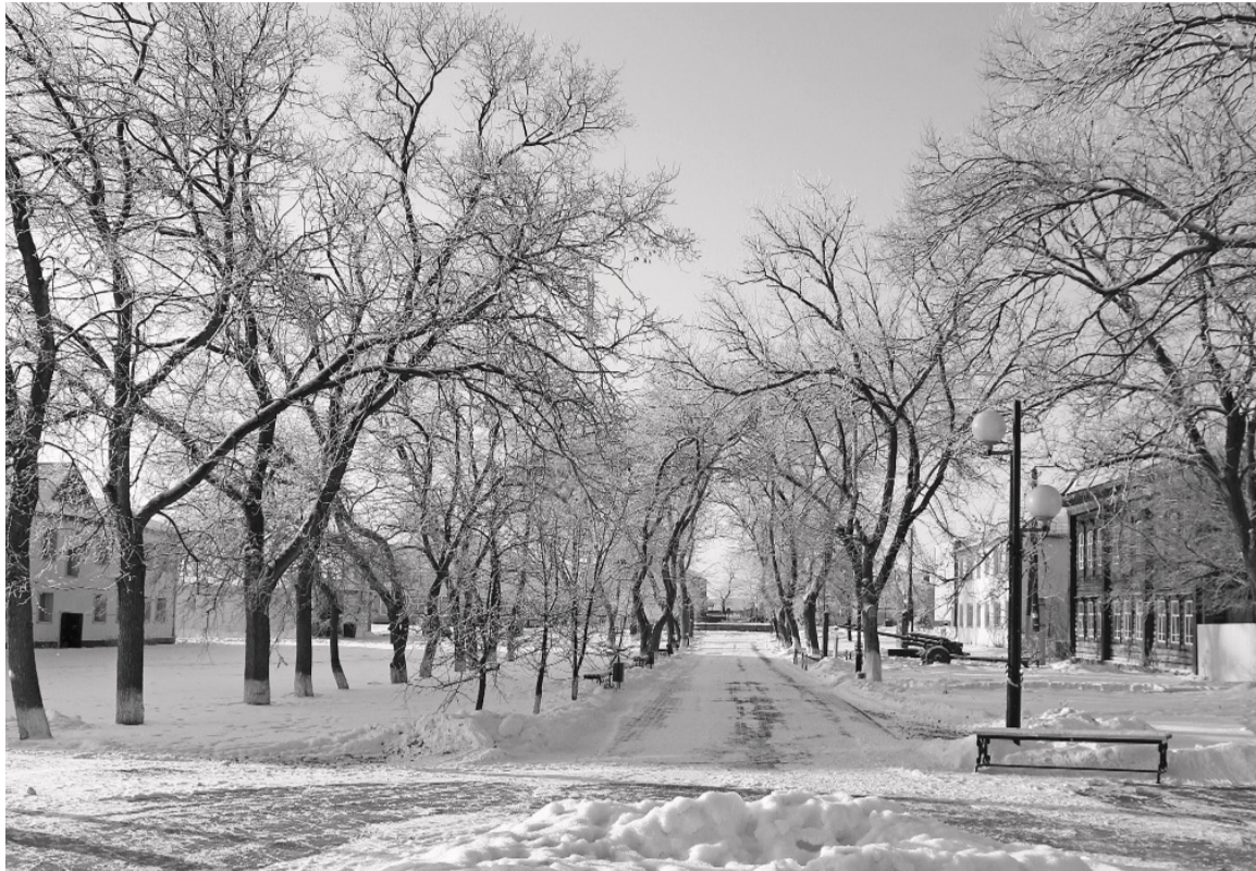
Зима – удивительное время года. И радует, и заставляет размышлять...