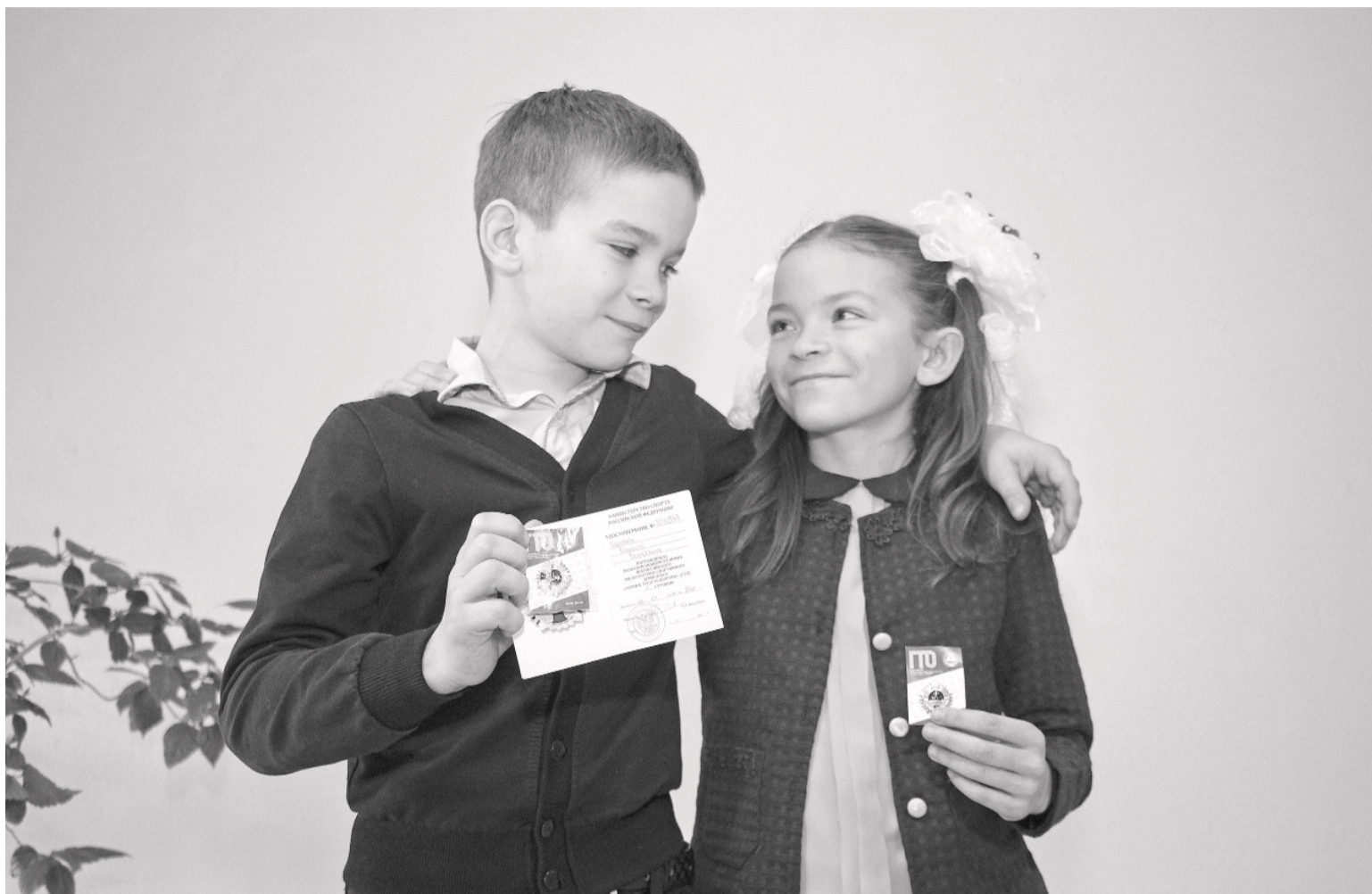
Брат и сестра со значками ГТО.