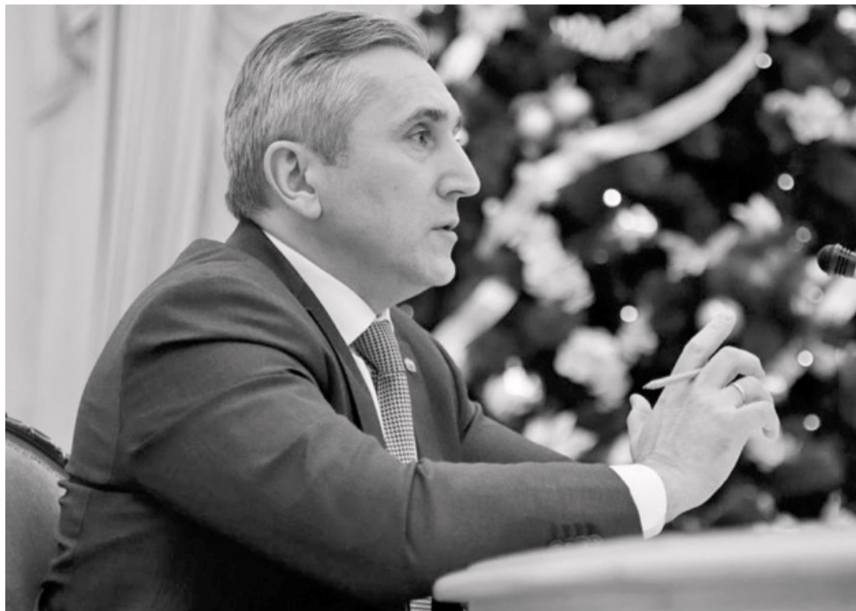
Александр Моор: «Нашему региону есть чем гордиться!».