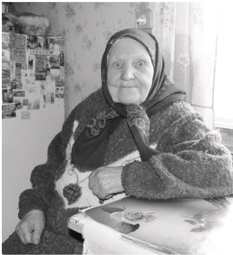
Александра Тимофеевна Некрасова.