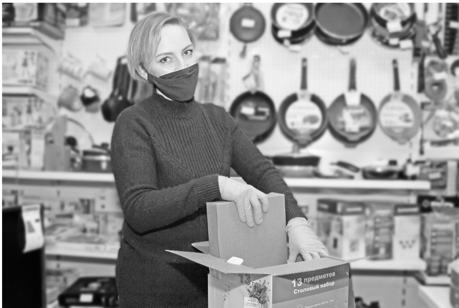
Продавцы магазинов подготавливают товар к доставке.