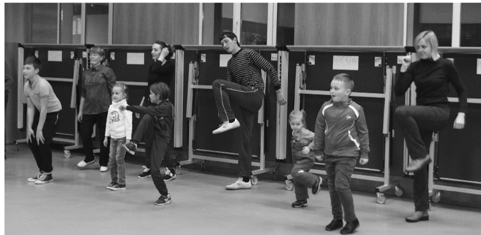
* Мамы и папы вместе с детьми участвовали в конкурсах.

Валентина ИВАНОВА, педагог-организатор ДДТ «Галактика»