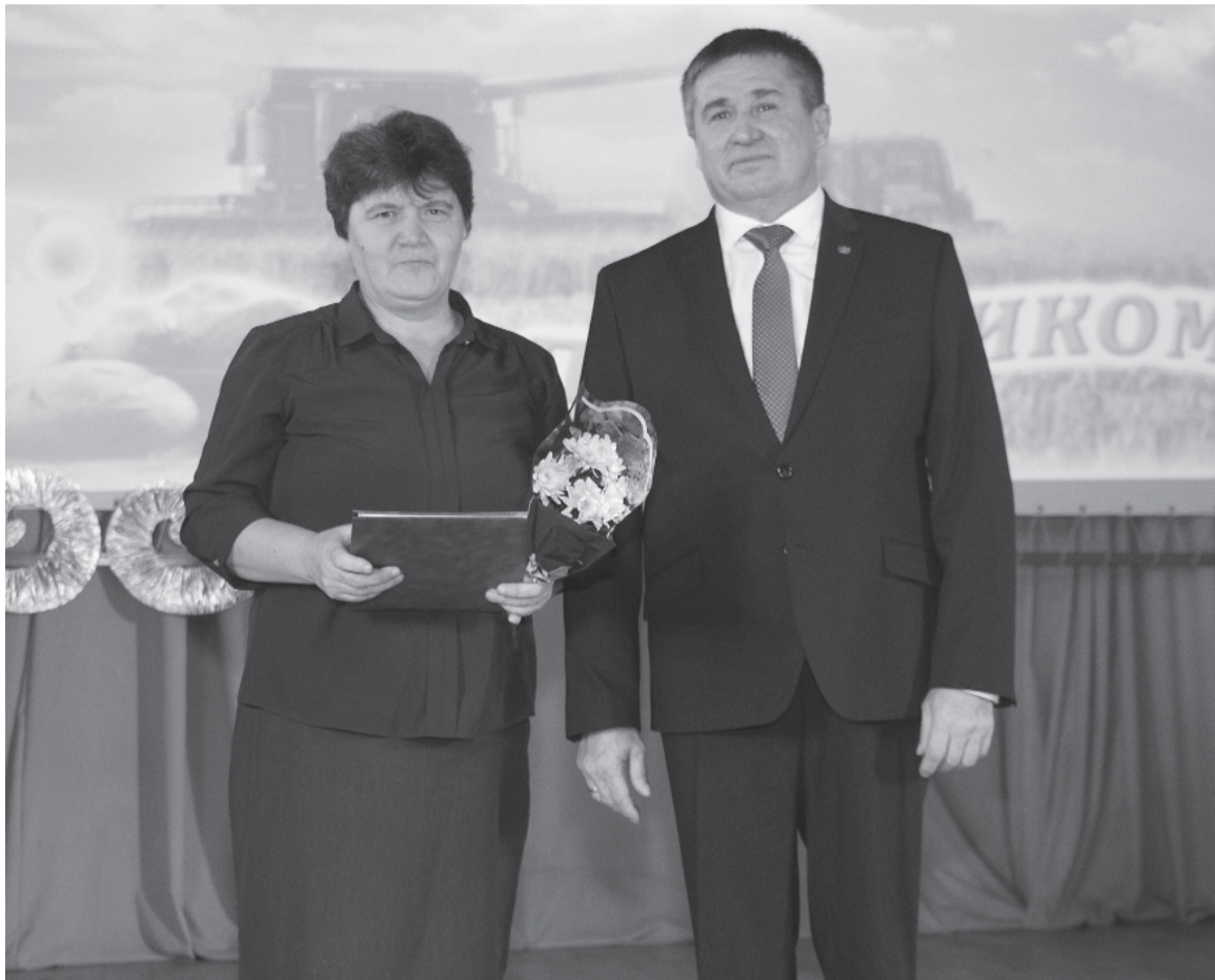
* В День сельского хозяйства и перерабатывающей промышленности лучшие работники принимали поздравления и награды.

Телефон: 8 (34555) 23-5-24. Администрация Сладковского муниципального района