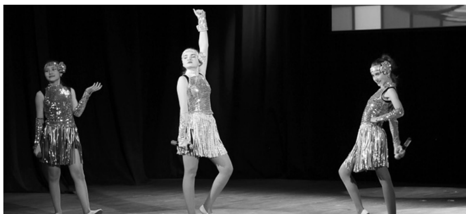
* Трио «Вдохновение» вызвало шквал эмоций своим выступлением!