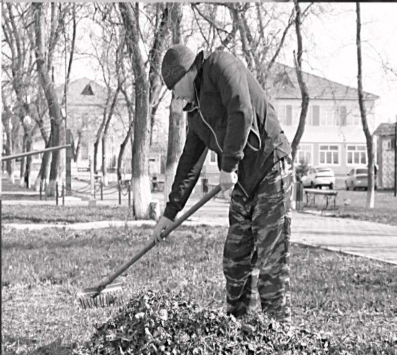
В райцентре ведутся работы по наведению чистоты.