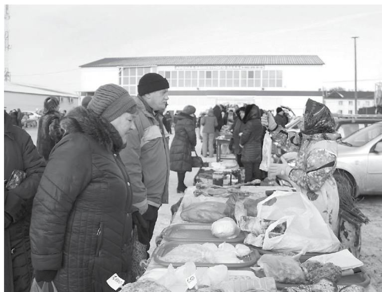
* На ярмарке ассортимент продукции был довольно широким.