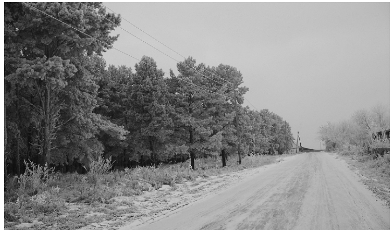
* Снова нас окружает зимняя красота природы.

Отруби, мука, зерно, сахар, продукты. Доставка – бесплатно. Обр.: т. 8 9523445656.