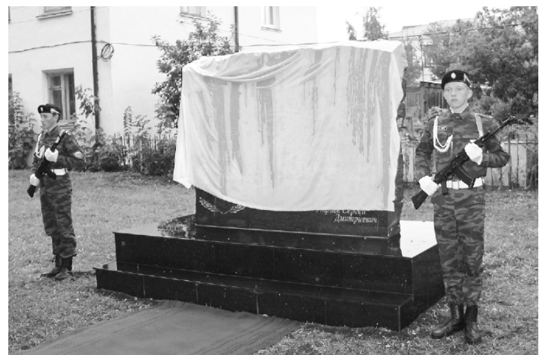
* Открытие обелиска воинам-интернационалистам и участникам локальных конфликтов.