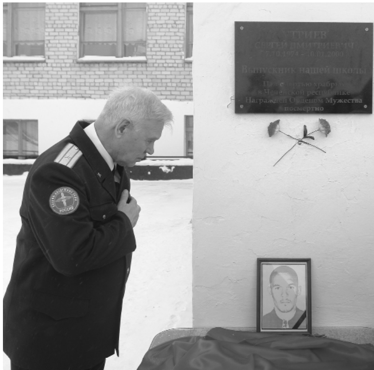
* Герой России Владимир Шарпатов склоняет голову перед портретом Сергея Утриева.