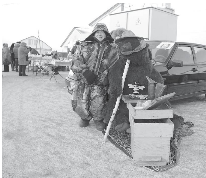
* «Подходи, покупай душистый мёд!»