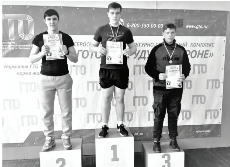
Победители районного турнира.

Школьники района приняли участие в соревнованиях