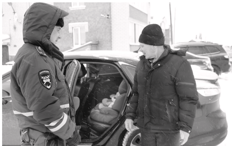
Сотрудники ОГИБДД напоминают правила перевозки детей.

Людмила ВЕРХОШАПОВА