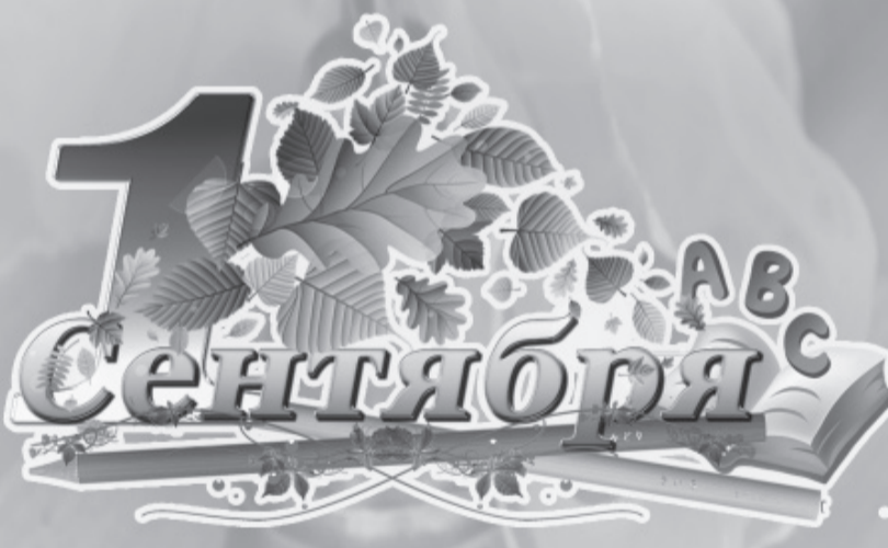
* «Здравствуй, школа!» – говорят ученики и учителя, вновь заходя в родные классы. Очередной учебный год стартовал!