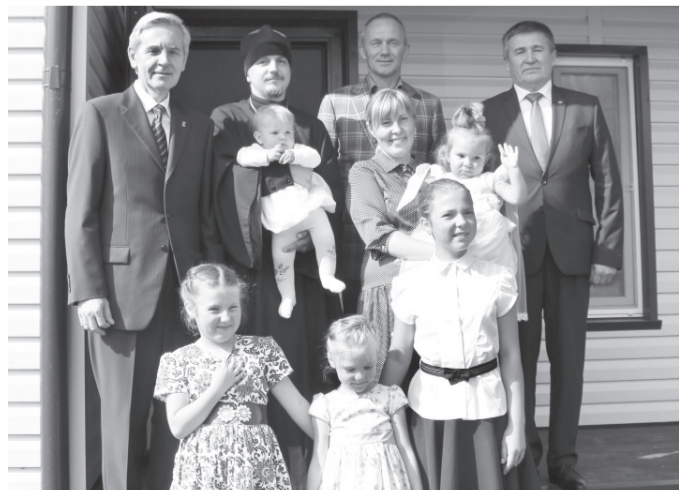
* Фотография на память с новосёлами.