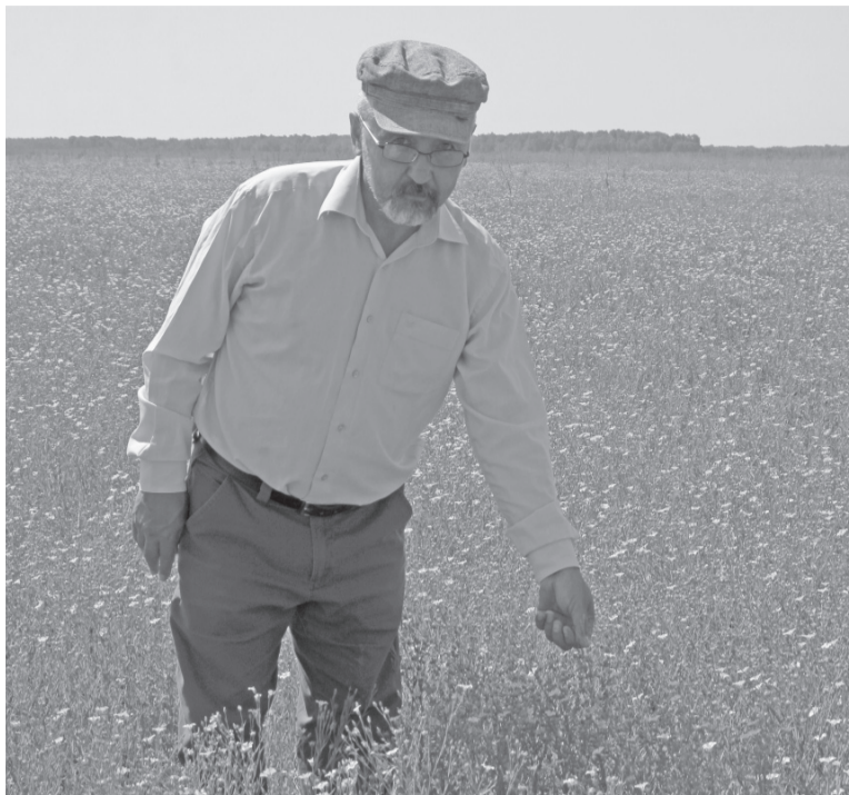
Цветущее льняное поле – гордость «Росы».

А вот июньские серые культуры, которые высевались третьим сроком, почувствовали не только влияние жаркого и засушливого лета. Молодые, сочные, свежие побеги привлекли внимание большого количества журавлей и лебедей, которые буквально атаковали поля хозяйства.