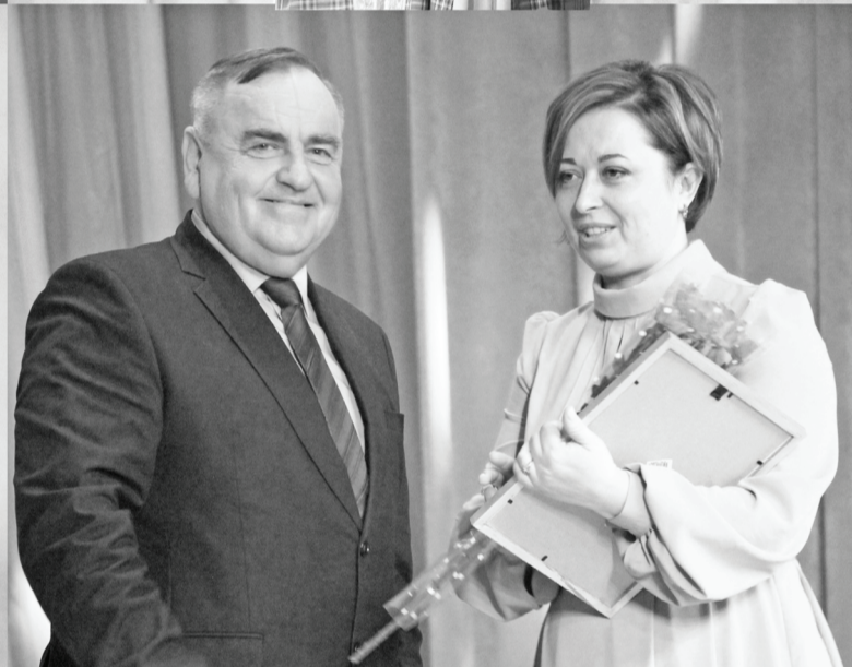
Люди самой праздничной профессии отмечены по заслугам.