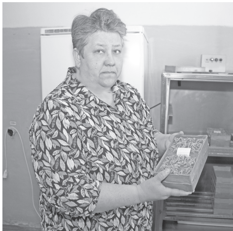
Семена поэтапно доводятся до посевных кондиций.

Специалисты «Россельхозцентра» делятся наблюдениями за кондиционными семенами