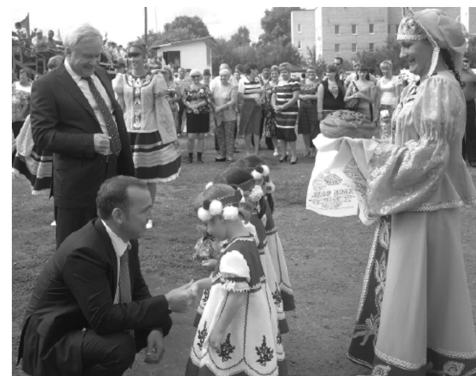
2013 год. Встреча почётных гостей во время празднования 90-летия Сладковского района.

У библиотек района появился доступ к полнотекстовым оцифрованным фондам Национальной электронной библиотеки.