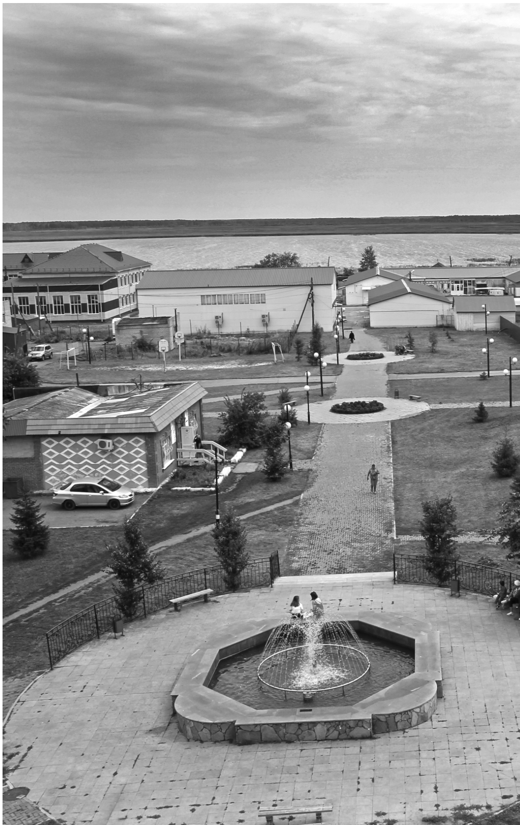
2019 год. Центральный парк села Сладково является

Работа районных предприятий и учреждений – часть социально-экономического развития области. И главная движущая сила малой родины, это, прежде всего, люди. Те, кто своим трудом каждый день делает жизнь своей земли комфортнее, качественнее, красивее, уютнее.