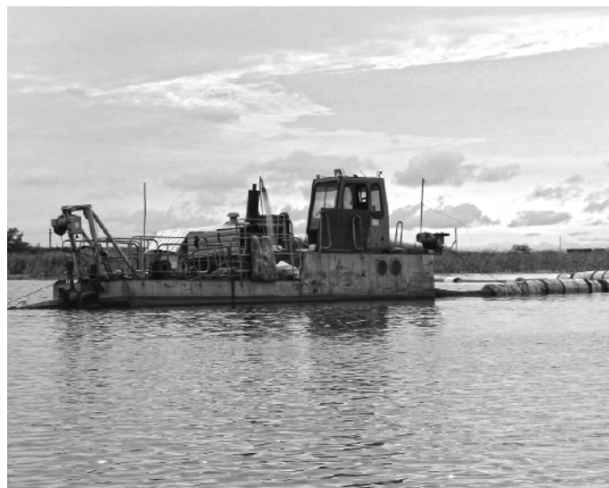
2016 год. На озере Дедюхино ведутся работы по очистке дна от иловых отложений.

В муниципалитете с каждым годом обновляется дорожная сеть. Строятся и ремонтируются дороги, тротуары.