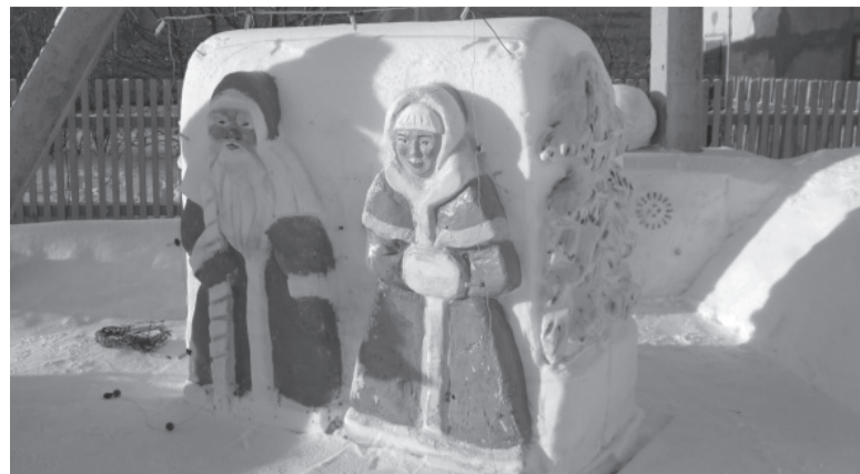
* Главные персонажи Нового года.

Людмила ВЕРХОШАПОВА