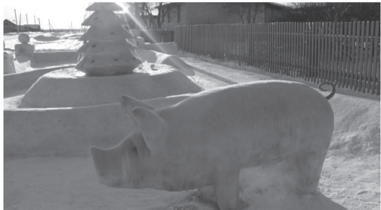
* Символ наступившего года по восточному календарю.

Людмила ВЕРХОШАПОВА