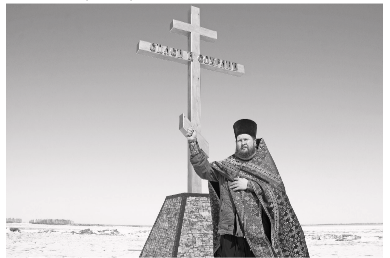
Таинство освящения креста провели служители церкви.

Людмила ВЕРХОШАПОВА