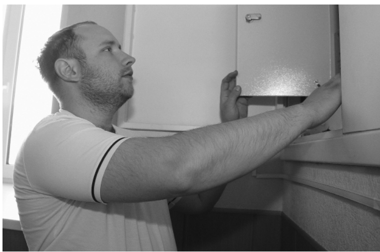
А.Кондратьев с электричеством на «ты».

— Когда речь идёт о школе, например, то мы все эти уч-