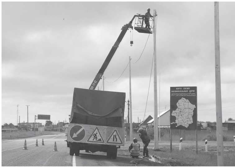
Ведётся установка дополнительного освещения.