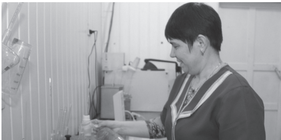
* На Масляном маслозаводе идёт проверка молочной продукции.

С каждым годом увеличивается и вылов рыбы. За текущий период 2018 года объём выловленного «озёрного серебра» составляет 1230 тонн. Сейчас в хозяйстве ведётся строительство второй очереди цеха по выращиванию рыбы, линии заморозки рыбы, линии по производству замороженных полуфабрикатов.