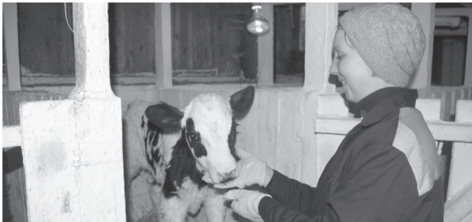
* Ветеринарное обслуживание важно в животноводстве.

Сладковский район – самый южный уголок Тюменской области. Наша малая родина располагается в сельскохозяйственной зоне, поэтому именно агропромышленный комплекс является фундаментом экономики муниципалитета.