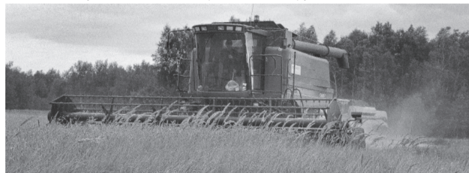
* На полях района работает мощная техника.

Кроме того, кооператив, являющийся флагманом АПК, постоянно расширяет производственные мощности. На отделениях «Таволжана» периодически возводятся новые фермы, строятся сельхозпомещения для содержания крупного рогатого скота. Всё сделано из качественных материалов, по новейшим технологиям, укомплектовано современным оборудованием.