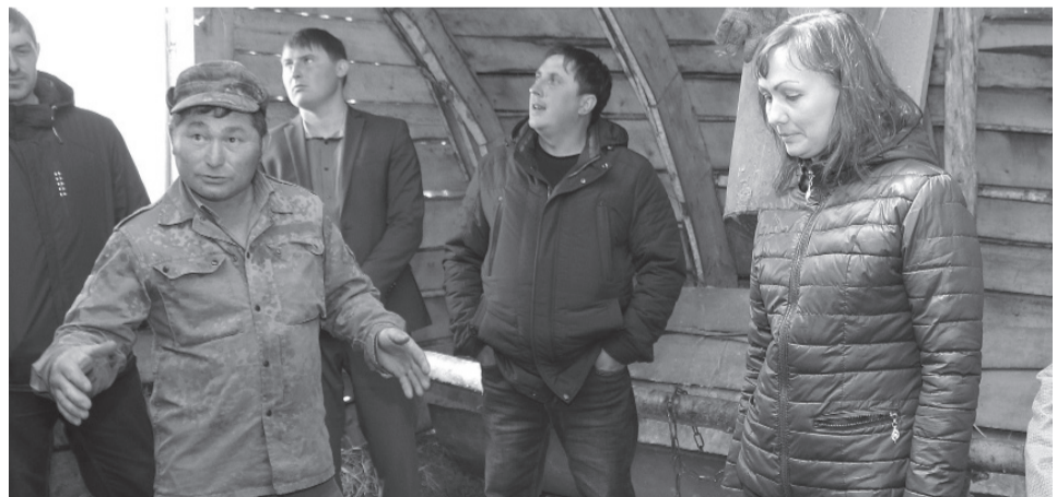
* Фермеры активно развивают свои ЛПХ.

Для того, чтобы все полевые сезоны проходили в оптимальные сроки, необходима мощная техника, позволяющая сократить время и оперативно справиться с работой. Сельхозпредприятия периодически обновляют машинно-тракторный парк.