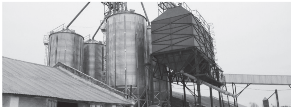
* ХПП модернизируют производственные мощности.

В условиях предъявления строгих требований к качеству молока кооперативы оснащаются современным оборудованием, чтобы вести проверку молочной продукции по всем критериям. Молоко из ОСХПК доставляется на Маслянский маслодельный завод.