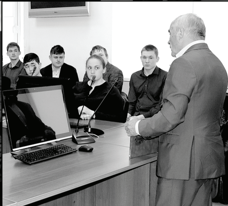
Депутат Тюменской областной Думы в ходе рабочей встречи поздравил ветерана войны и провёл урок для школьников.