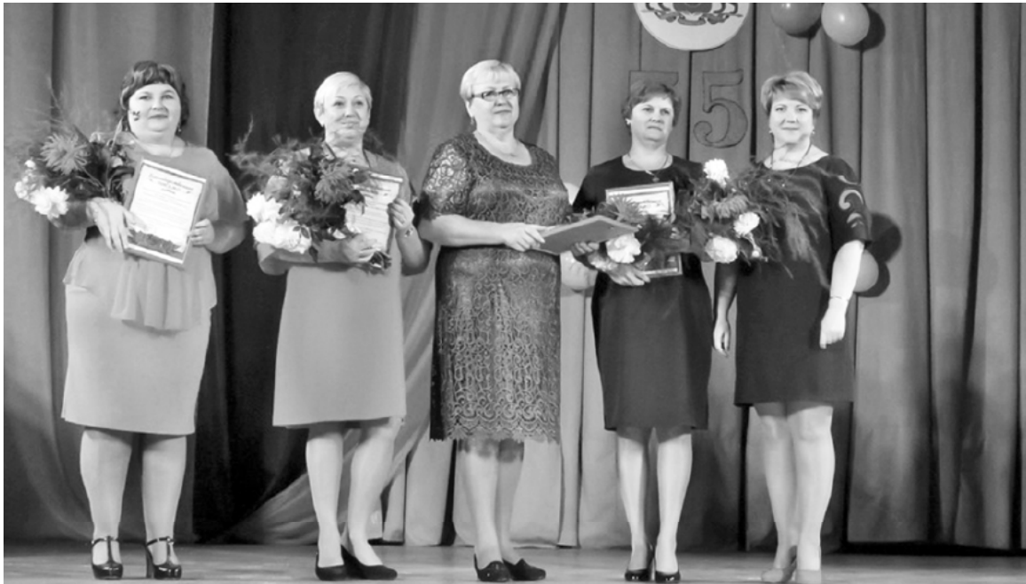
Поздравления принимает женская вокальная группа «Вдохновение».