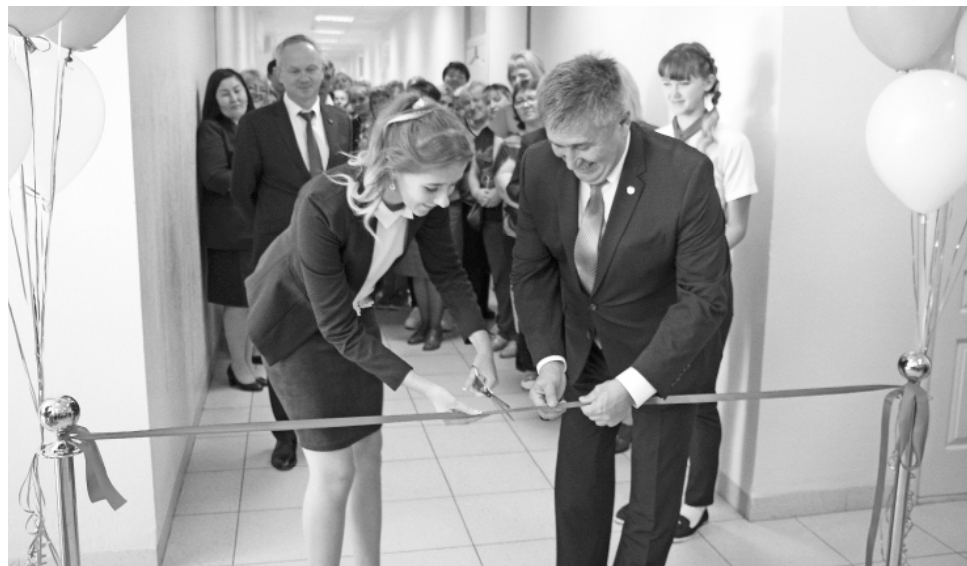
Торжественное открытие образовательного центра.