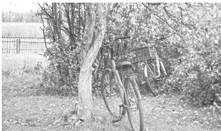
«Железные кони» на отдыхе.