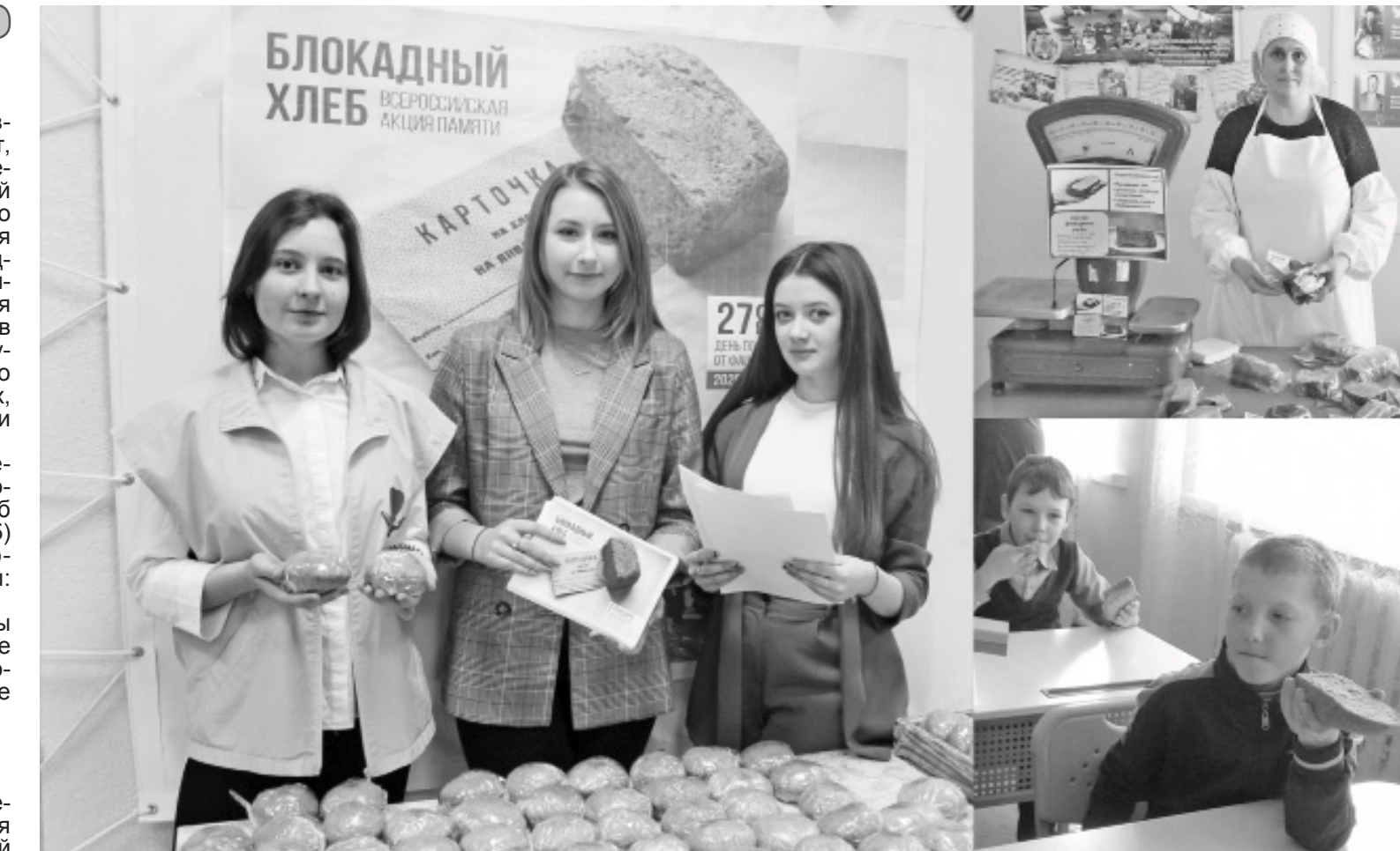
К проведению акции присоединились все школьники муниципалитета.