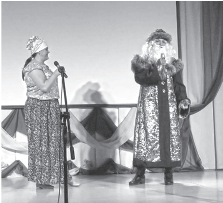
Майские актёры поднимали настроение яркими номерами.