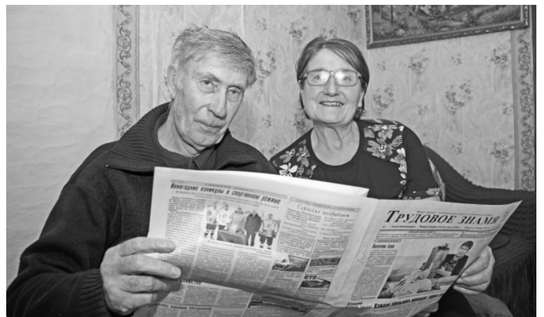
Семья Леушкиных в числе самых активных подписчиков.

Людмила ВЕРХОШАПОВА