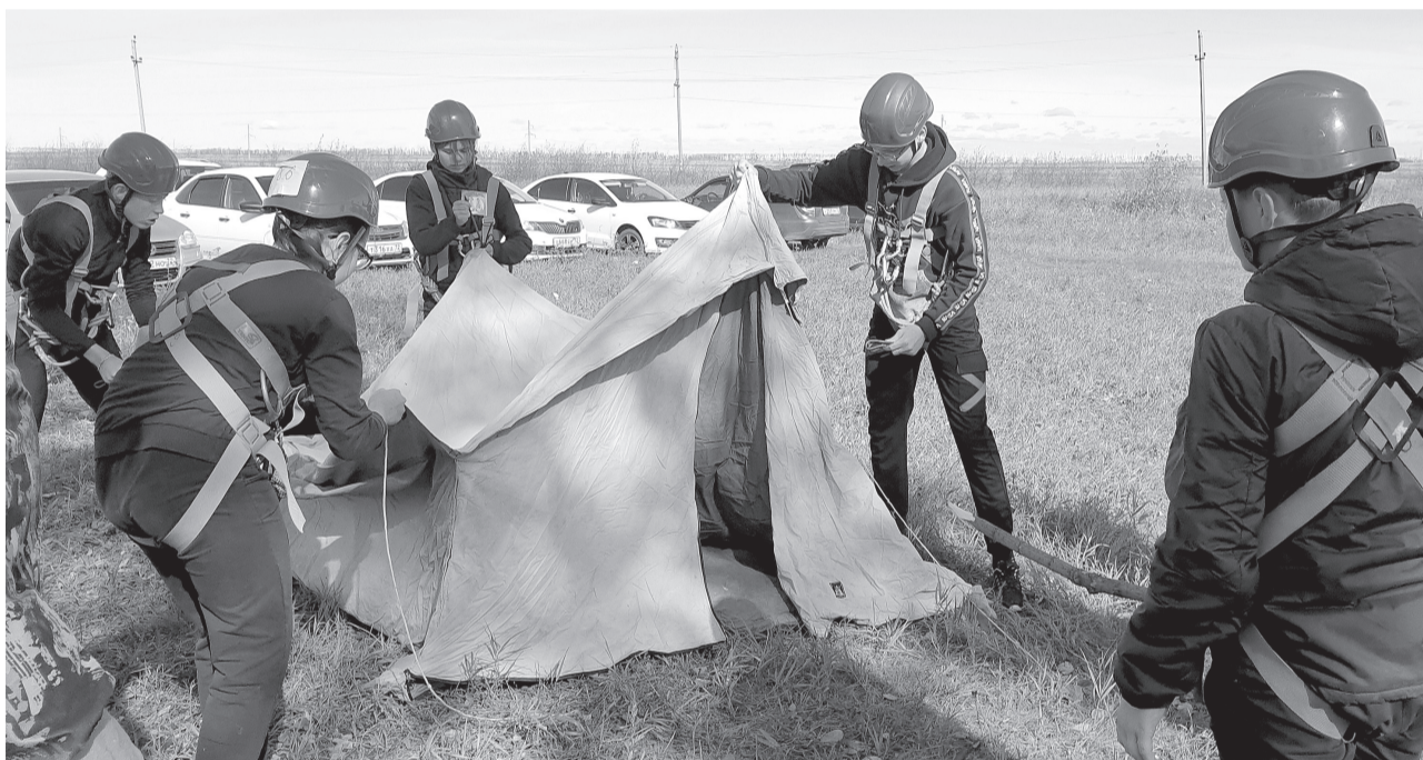
Сладковские школьники на туристическом слёте закалили характер и получили море эмоций.