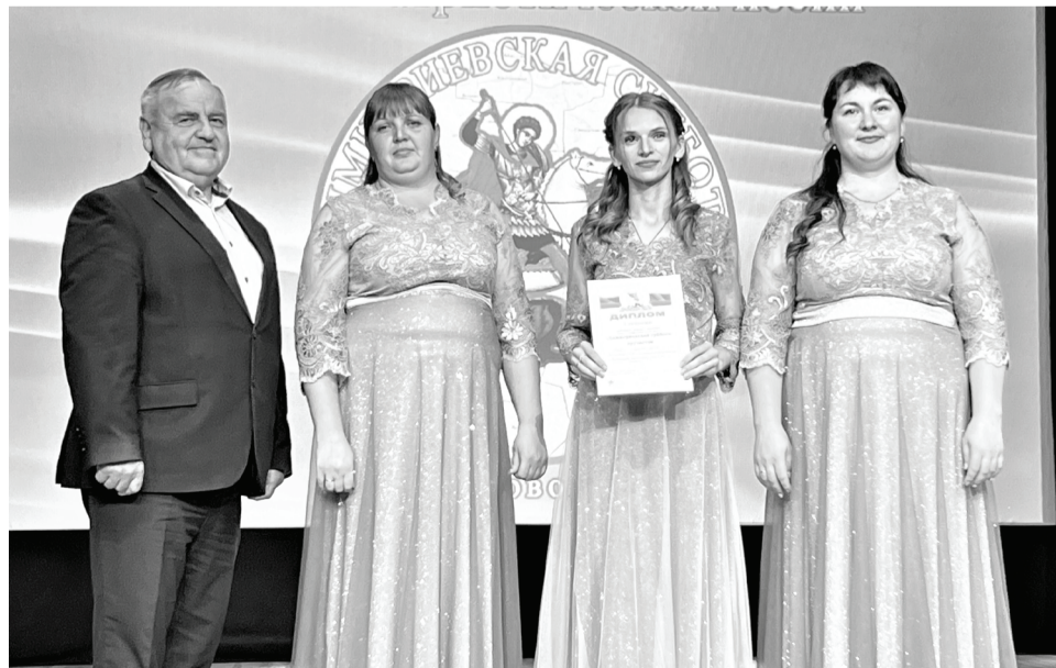
Торжественное награждение победителей конкурса «Димитриевская суббота».