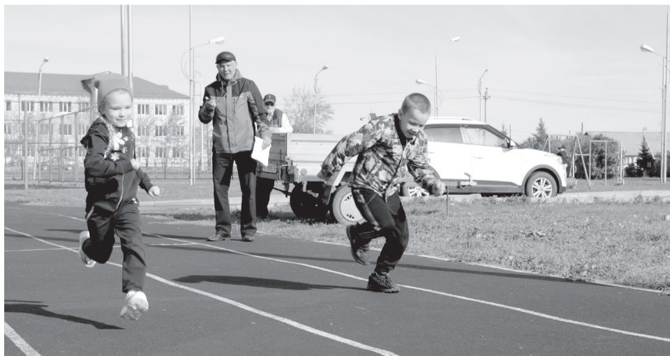
Ребята достойно прошли все испытания.