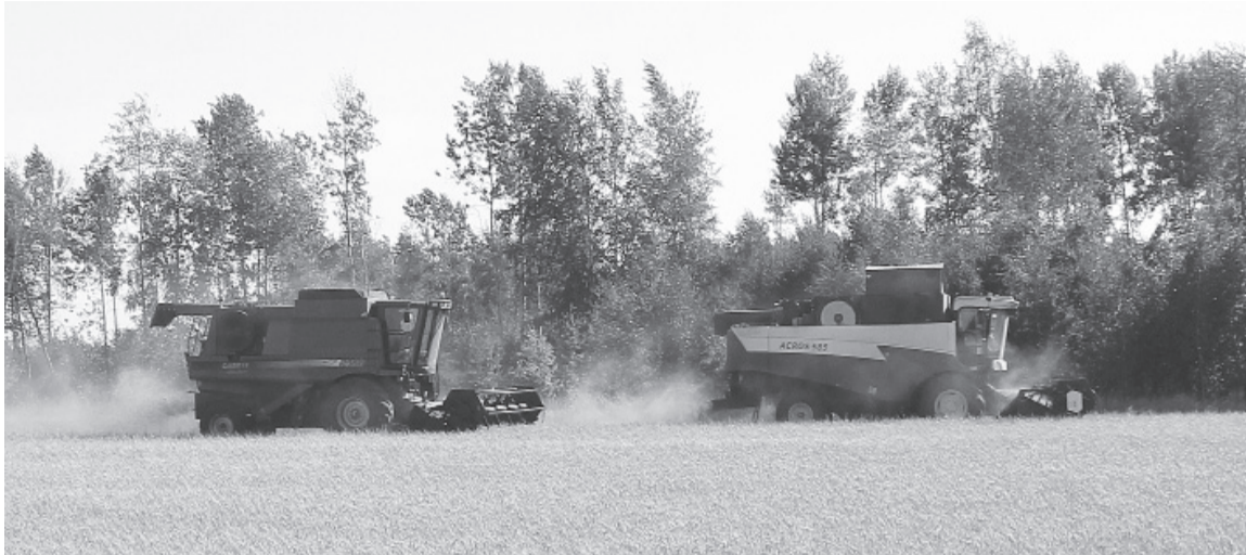
На жатве последних гектаров посевной площади.

Полеводы кооператива первыми в Тюменской области среди предприятий с посевными площадями зерновых и зернобобовых культур свыше трёх тысяч гектаров завершили уборочную кампанию