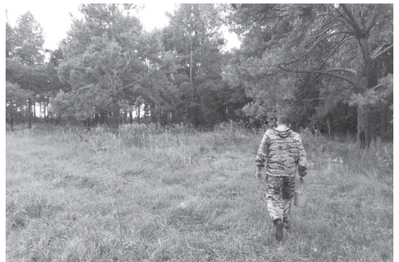
При поиске грибов будьте внимательны.