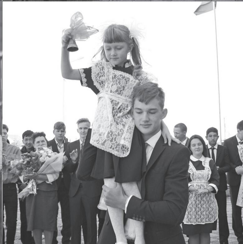
Торжественные линейки собрали главных героев образовательного процесса – первоклассников и выпускников.