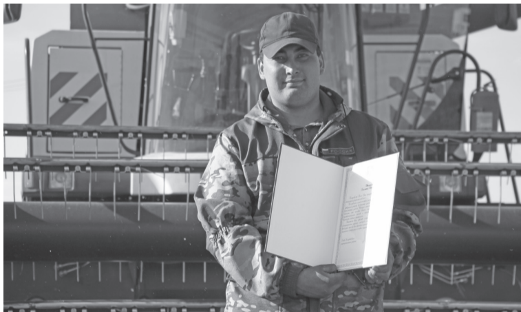
Награда в руках главного агронома.

— Давно такой засухи не было. А когда в августе дожди пошли, то для урожая это уже смысла не имело. Только грязь