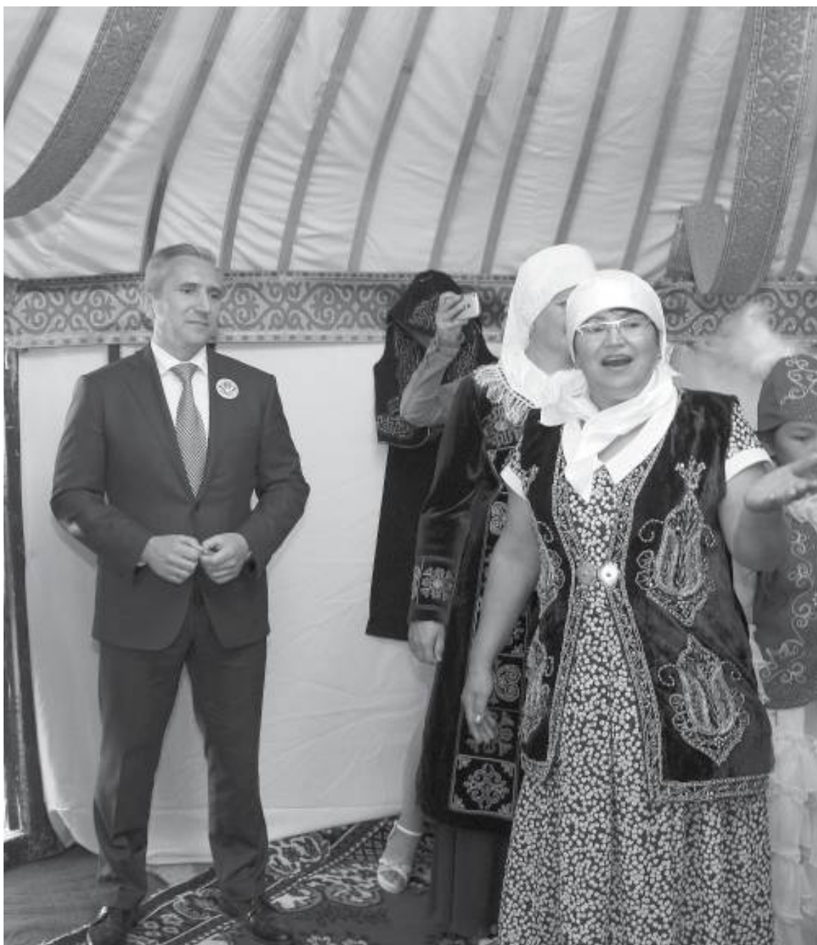
* Менжинские казахи встречали гостей с национальным гостеприимством, радушием. В юрте был накрыт богатый дастархан.