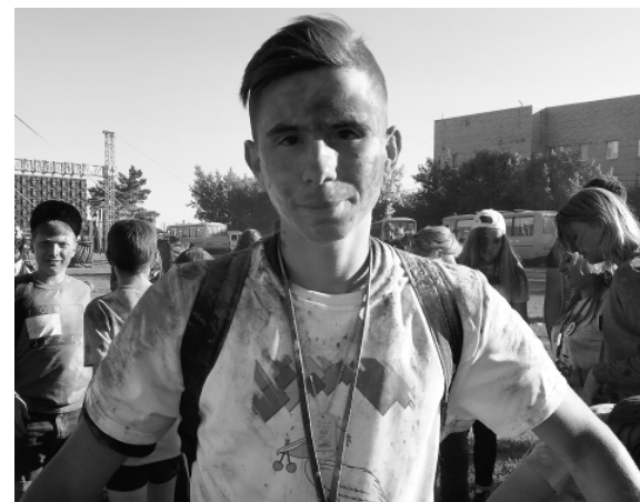
* Программа празднования дня рождения района — с раннего утра и до позднего вечера — была увлекательной!