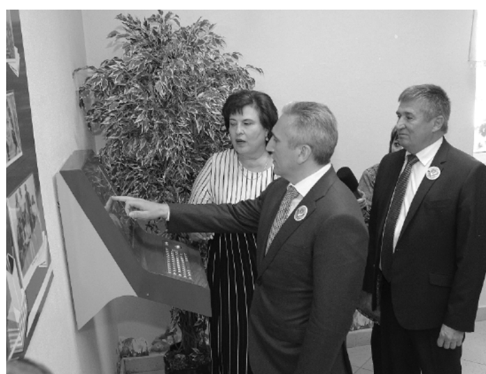
* У инфокиоска в Сладковской средней школе.