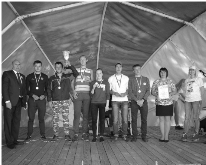
* Победители забега – майские спортсмены.