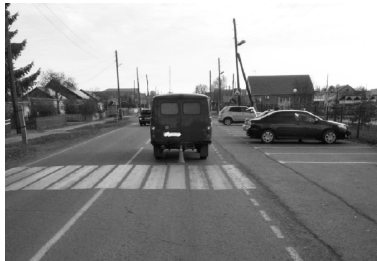
* Перед нерегулируемым переходом нужно снизить скорость.

Людмила ВЕРХОШАПОВА