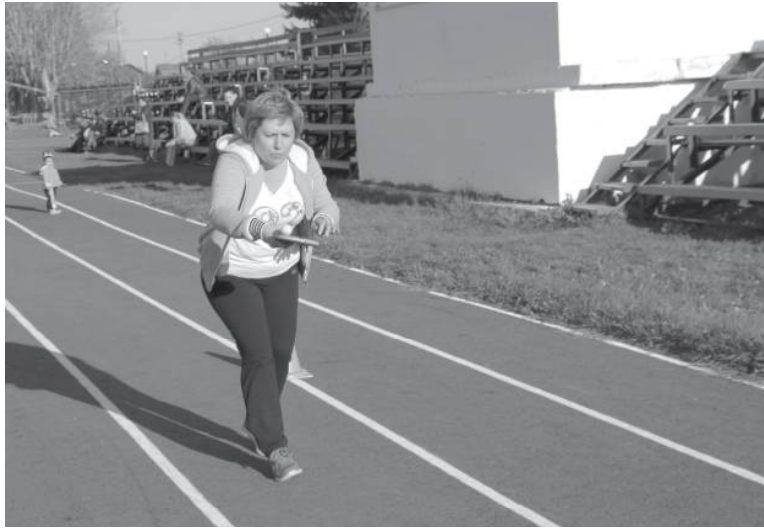
* Спорт – это жизнь!

Ищу любую физическую работу, ремонты квартир и всё, что связано со стройкой. Цена ваша – работа моя! Быстро, качественно! Тел.: 8 9224842074.