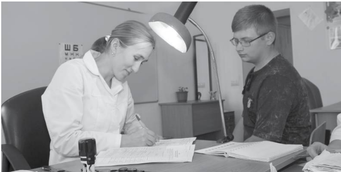
* Будущие защитники Отечества прошли медицинское обследование.