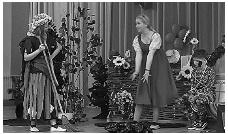
* Фрагмент театральной постановки.