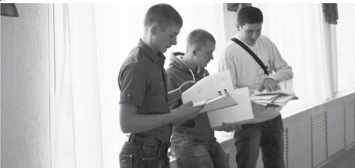
* В Сладковском районе состоялась осенняя призывная комиссия.