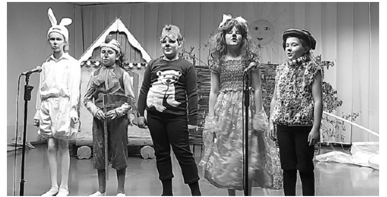
* Ребята выступали просто замечательно!

Юлия КЕРН, специалист по методике клубной работы МАУК «Овация»