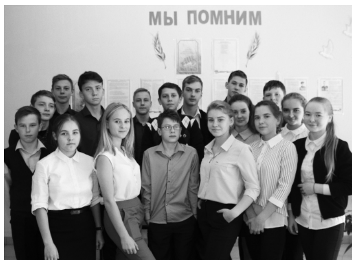
* 8 «б» — пример для каждого!