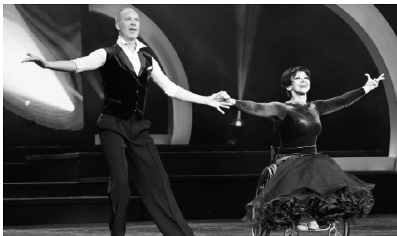
* «Танцы на колясках» для присутствовавших гостей.

Людмила ВЕРХОШАПОВА