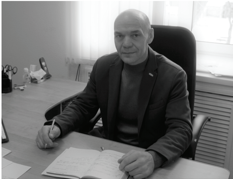
Руководитель районного филиала авиабазы отметил сложность прошедшего сезона.

– С кем взаимодействовали сотрудники авиабазы, какие ведомства были задействованы в предотвращении и тушении пожаров?