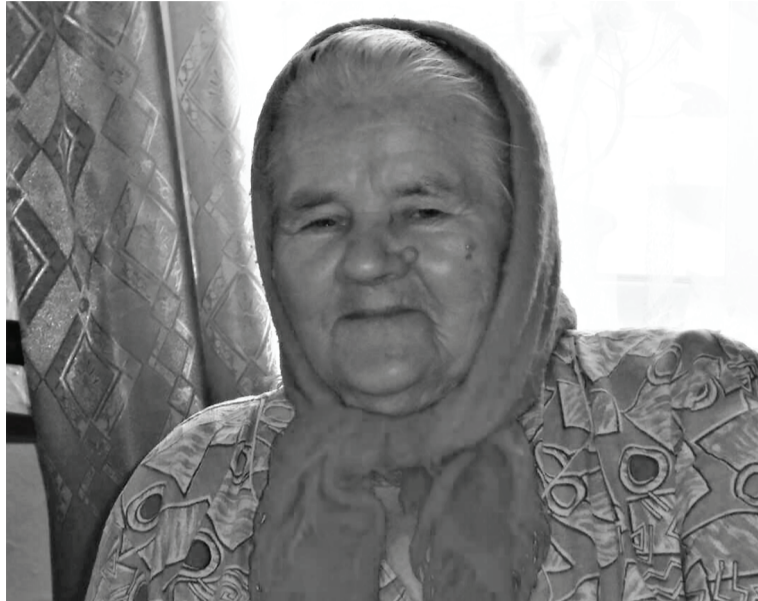
Пандемия отняла у нашей семьи любимого и дорогого человека.

Когда началась пандемия коронавируса, многие не все-рьёз воспринимали это заболевание. Чуть, байка, очередной непонятный правительственный ход... И другие подобные мнения можно было услышать. Они есть и до сих пор. И только те, кто испытал ужас потерь или на себе узнал, что такое Covid-19, понимают опасность нынешней обстановки и стараются защитить себя и своих близких.