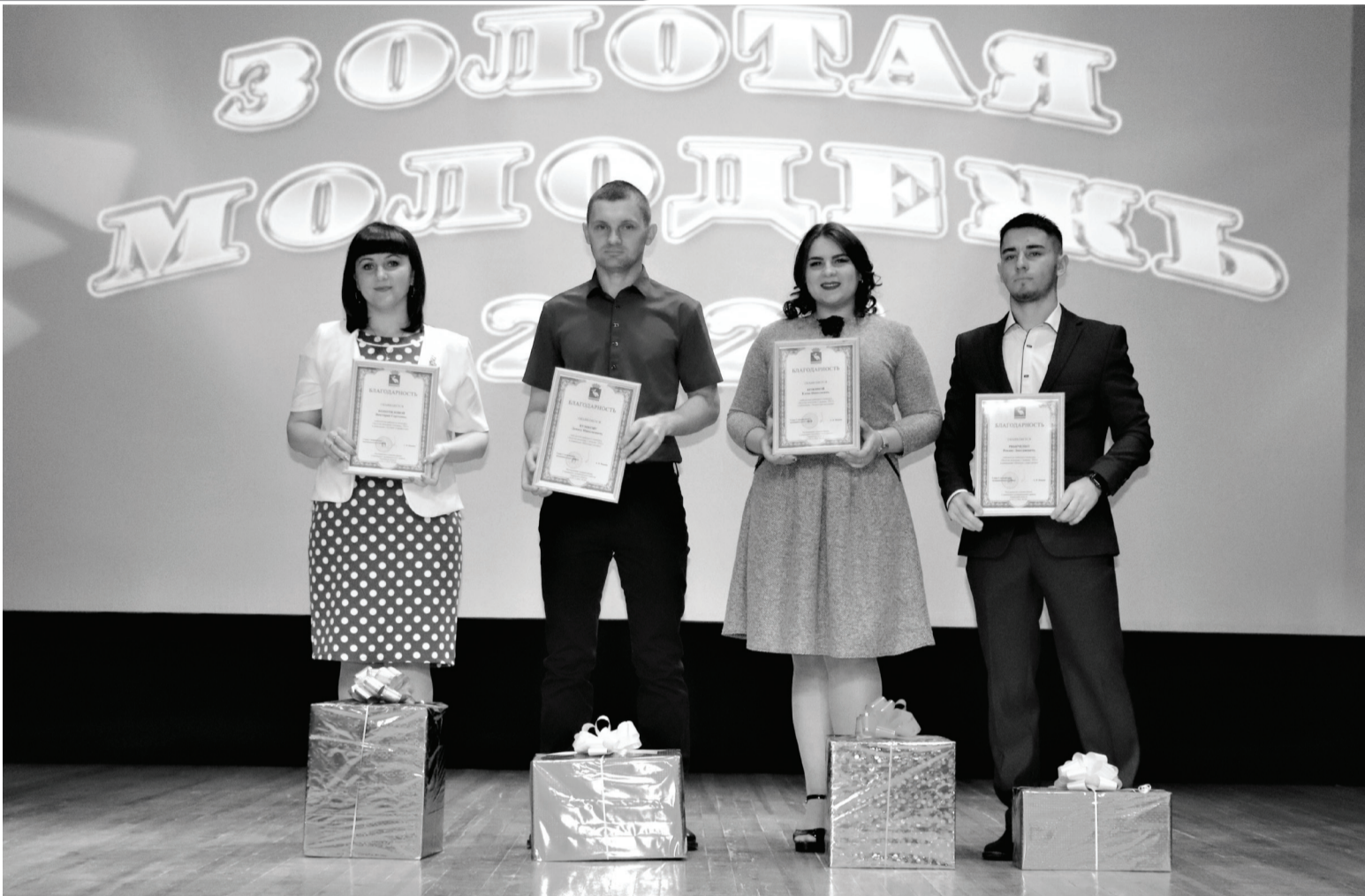
Победители районного конкурса получили заслуженные награды.