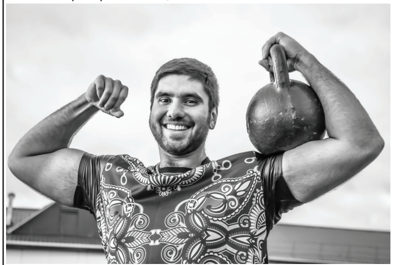
Ветеринар уверен, что спорт воспитывает характер.