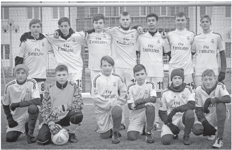
Команда спортсменов, пробившихся в финал.

10 и 11 октября в городе Ишиме состоялись зональные соревнования по футболу среди юношей 2005-2006 г.р.