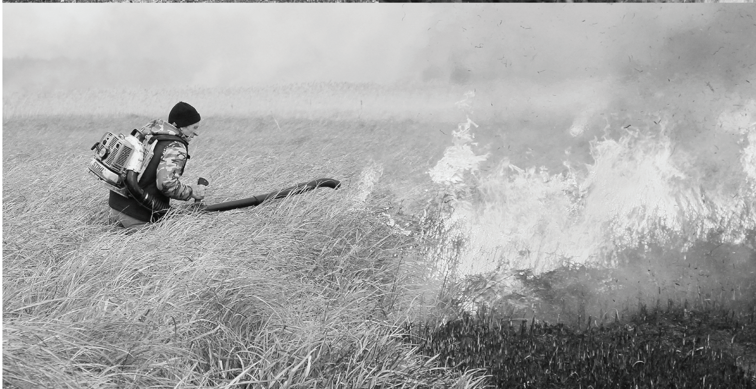
Сотрудники Тюменской авиабазы ведут борьбу с пожарами на землях лесного фонда.