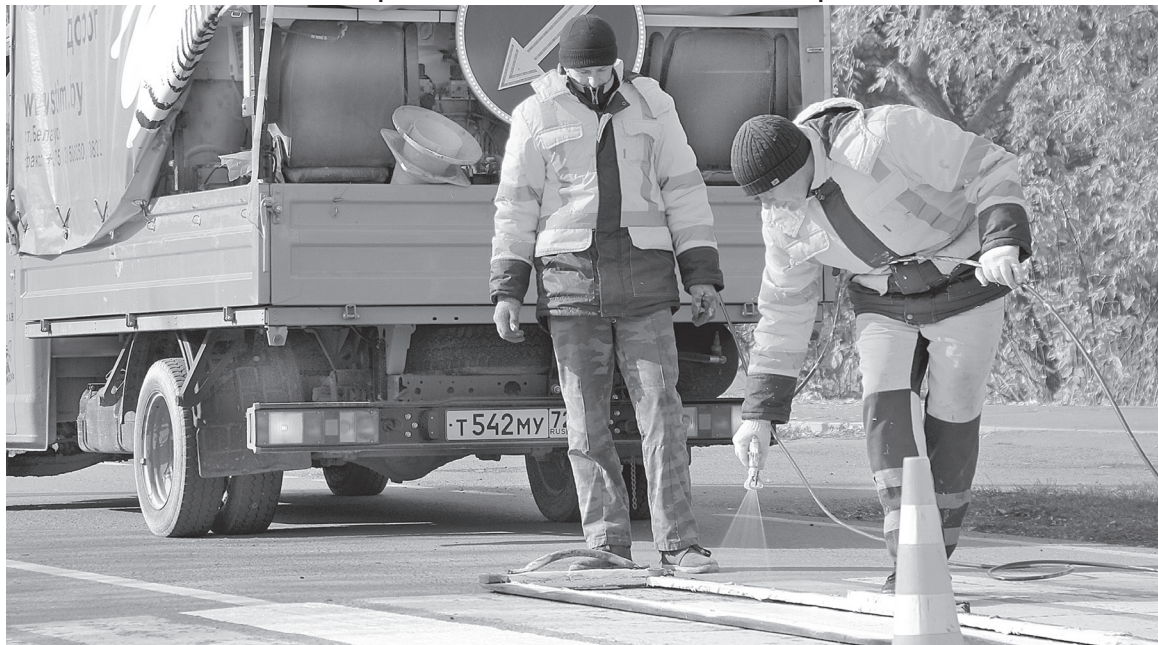
Сотрудники АО «ТОДЭП» провели работу в рамках муниципального контракта.

Работа проводилась в рамках муниципального контракта по содержанию автомобильных дорог