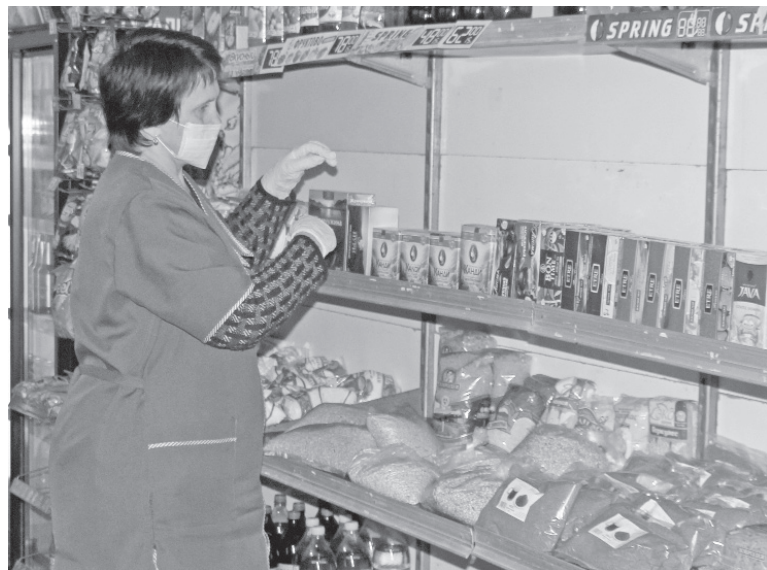
На прилавках магазина – товары, пользующиеся спросом.

Государственная поддержка помогла жительнице посёлка Маслянский продолжить семейное дело