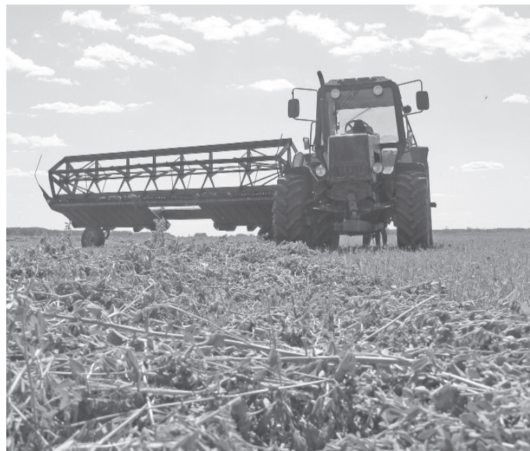
На сладковских полях кипит работа.

На поле уже скошенная трава лежит в валках. Механизаторы делают паузу в работе. Люцерна должна провялиться до влажности семидесяти процентов при использовании консерванта. И далее можно приступать к этапу её хранения. В этом тоже есть свои нюансы.