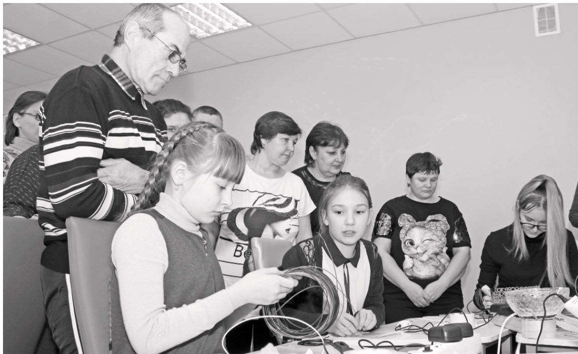
Гости мероприятия с интересом наблюдали за деятельностью школьников.