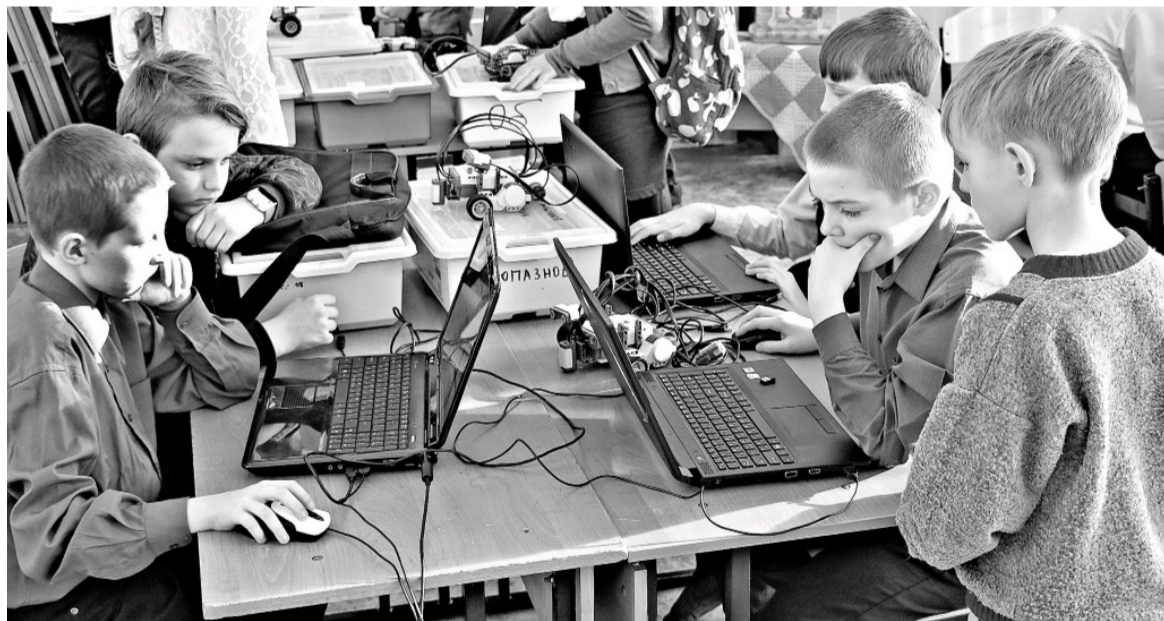
Участники полностью погрузились в процесс выполнения заданий.

Ольга ЧИБИЗОВА, методист ДДТ «Галактика»