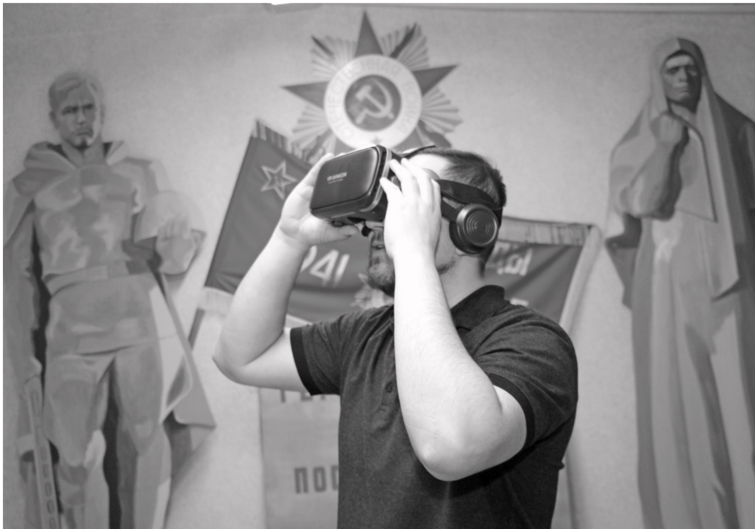
Новое современное оборудование делает экскурсии более интересными и впечатляющими.