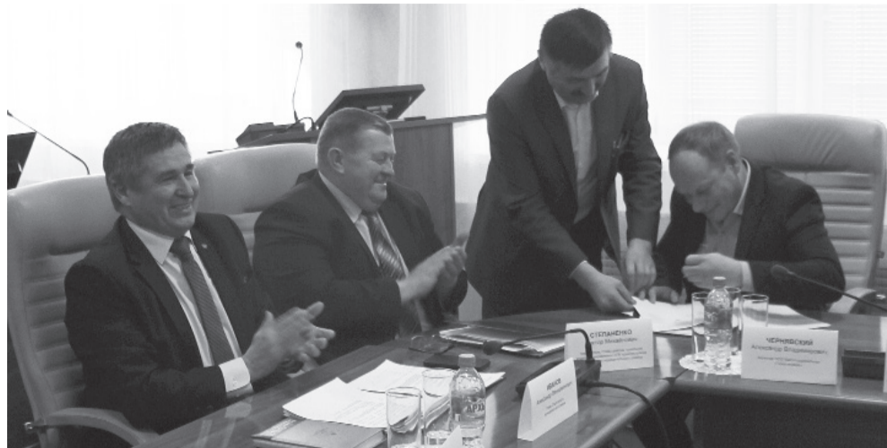
* Подписание протокола по объёмам и цене сырого молока.