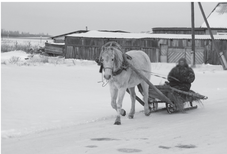
* Зимние деревенские будни.