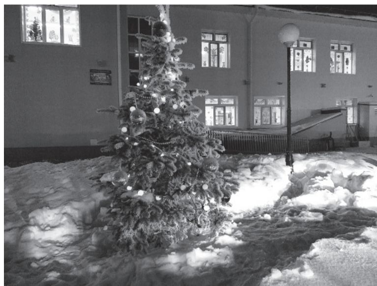
* Новый год совсем скоро.