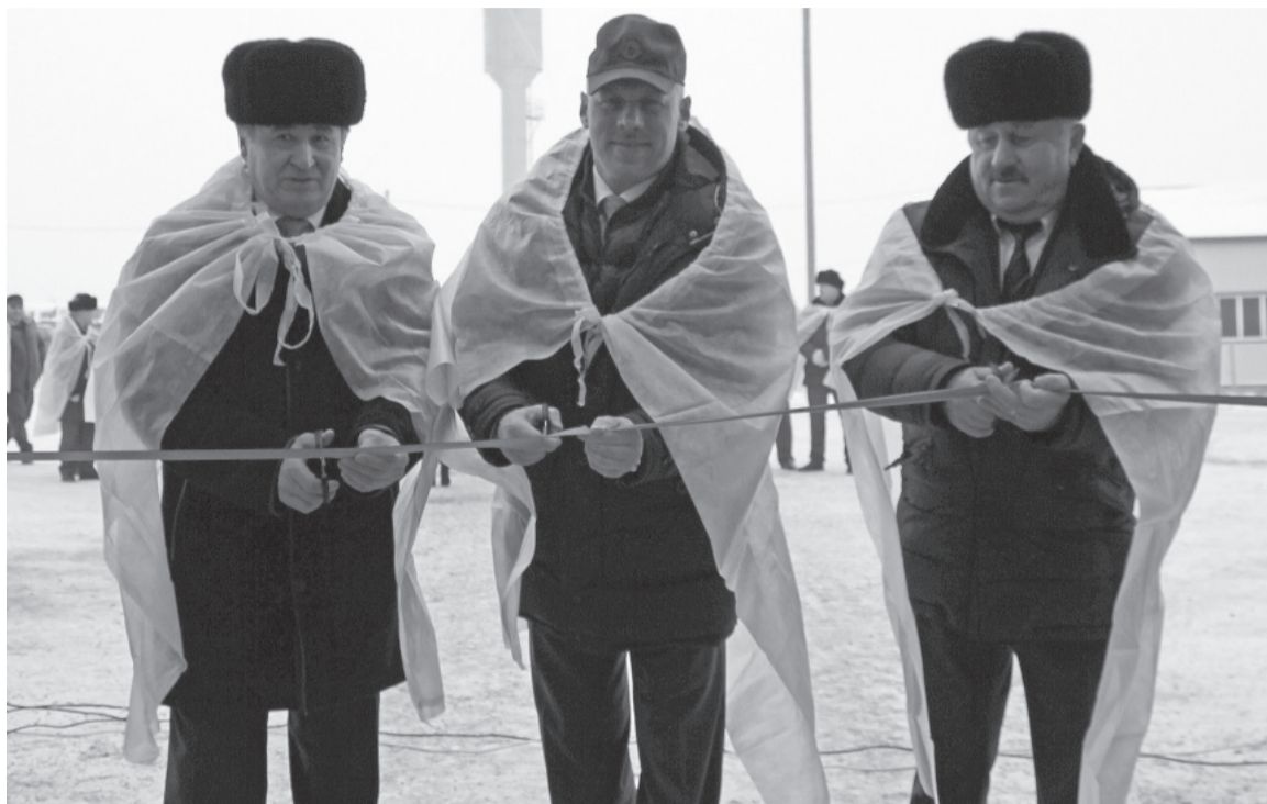
* На торжественном открытии Никулинской новой фермы.