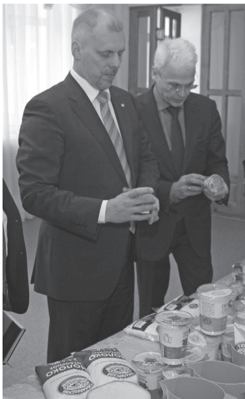
* Во время презентации.

После совещания представители маслосыркомбината провели небольшую