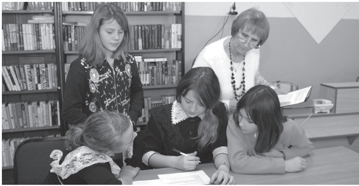
* В библиотеке часто проводятся интересные тематические мероприятия.