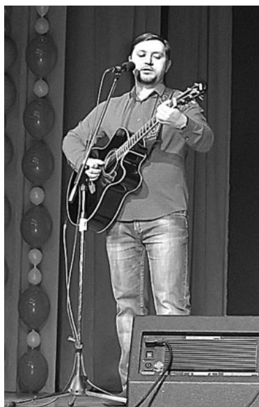
* Песня в подарок.