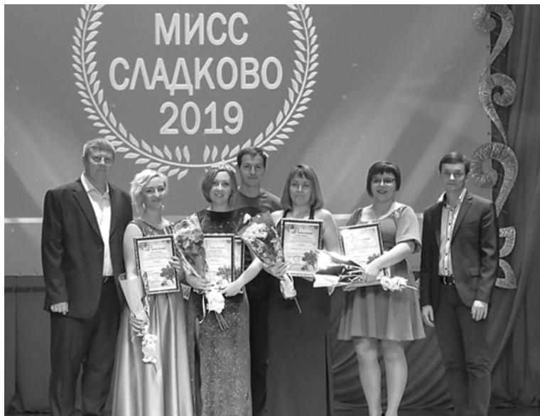
* Участницы конкурса и члены жюри. Фото на память.