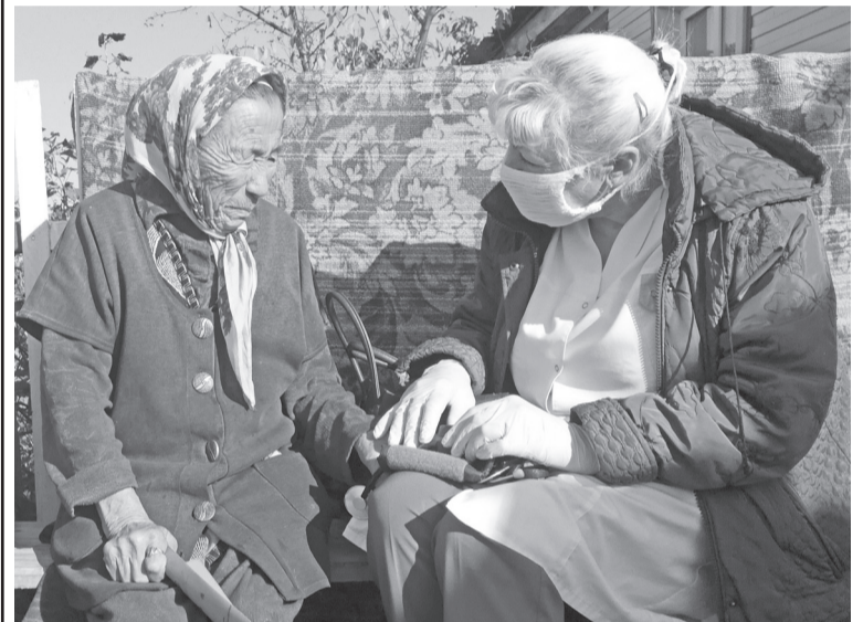
Медицинская сестра районной больницы провела профилактический осмотр граждан пожилого возраста.

Людмила ВЕРХОШАПОВА Фото из архива КЦСОН