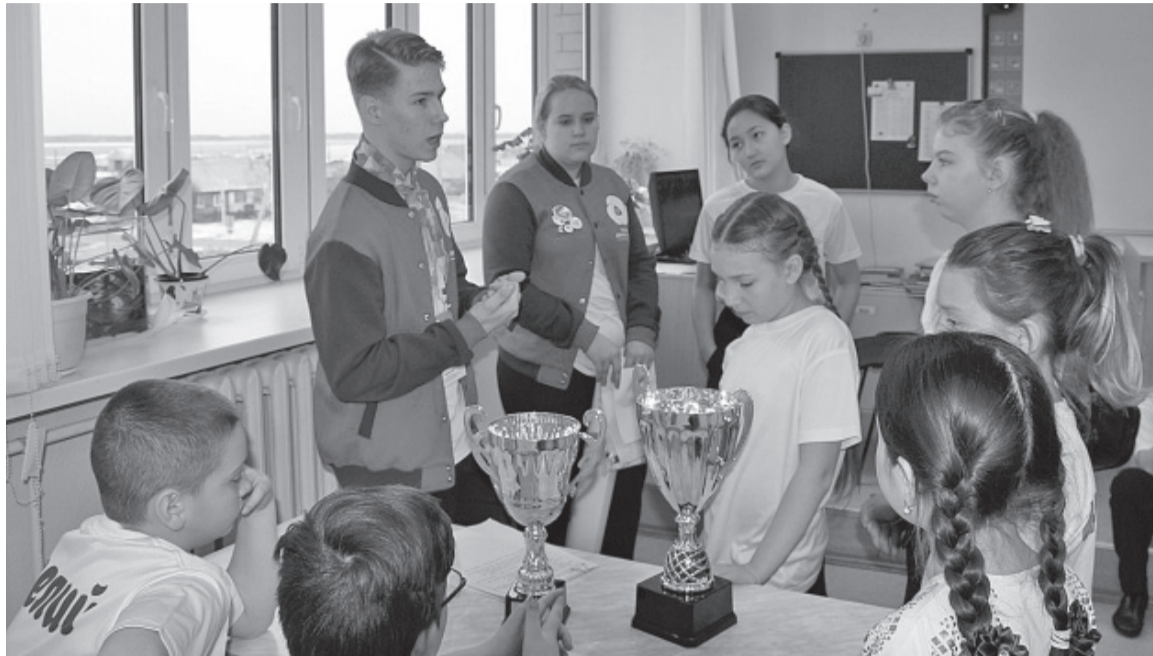
Районные слёты РДШ – традиционные мероприятия.

В 2020 году исполняется пять лет Российскому движению школьников