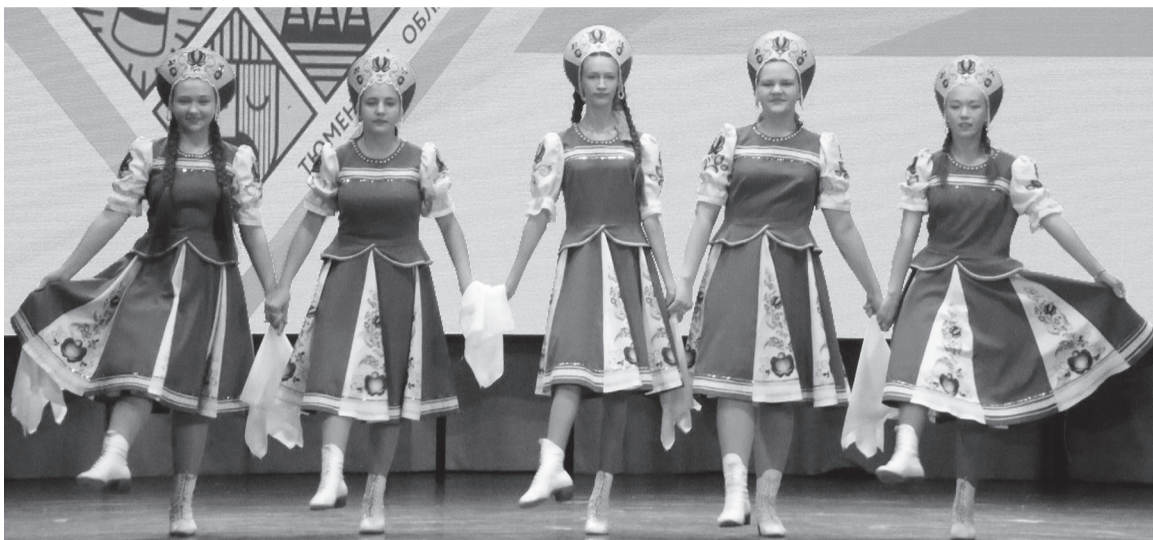
Коллективы Сладковского района показали свои таланты на региональном уровне.

В Гольшмановском городском округе в минувшую субботу, 16 сентября, прошёл первый этап V регионального фестиваля-конкурса любительских творческих коллективов Тюменской области.