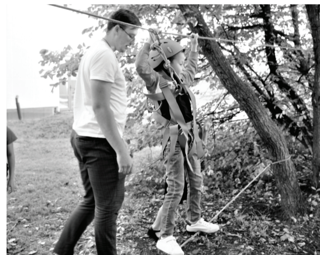
Мир спорта и творчества вновь распахнул свои двери для юных сладковцев.

Школа «Темп» с 15 сентября распахнула свои двери для юных спортсменов.