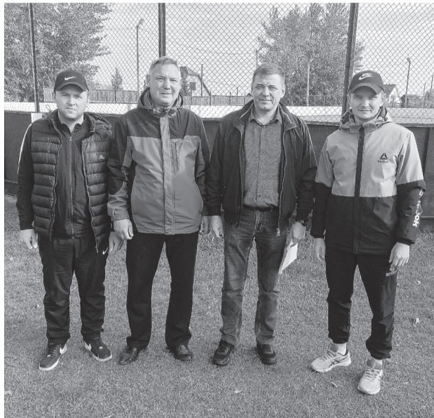
К спортивным баталиям будем готовы!

В Сладковском районе обсудили подготовку к хоккейному сезону.