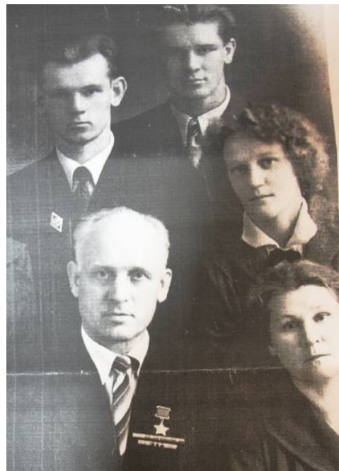
* Герой Советского Союза в кругу родных и близких.