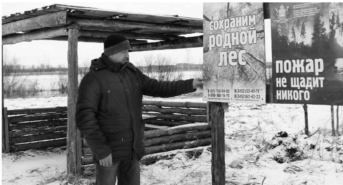
В оборудованных местах отдыха установлены беседки, лавочки и информационные аншлаги.