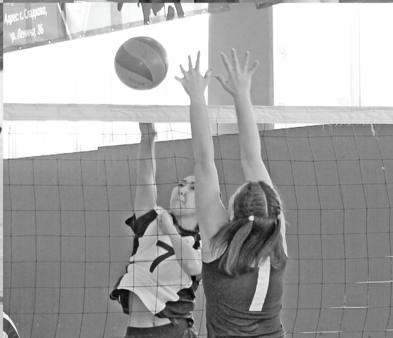
Борьба хоккеистов, бег лыжников, состязания волейболисток, вручение цветов – моменты спортивного праздника.