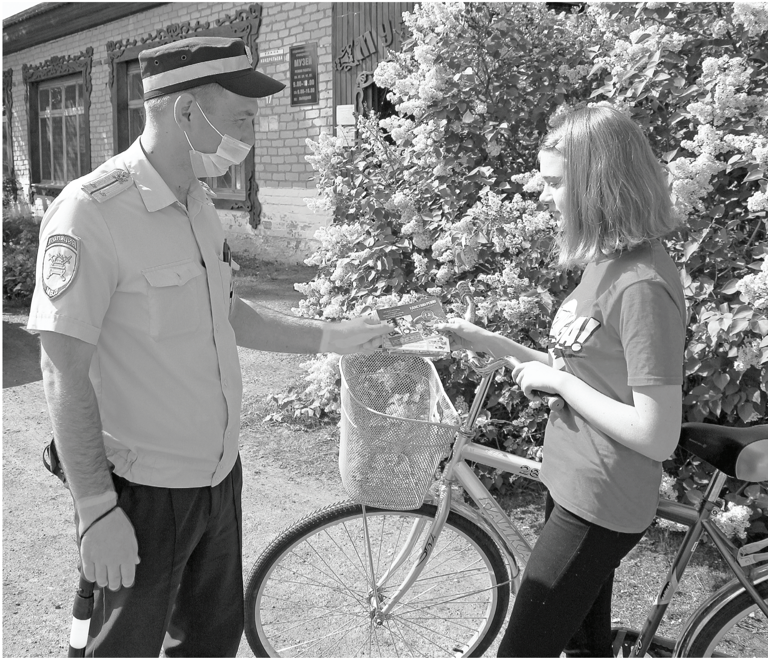
Юным велосипедистам и пешеходам вручают памятки о Правилах дорожного движения.