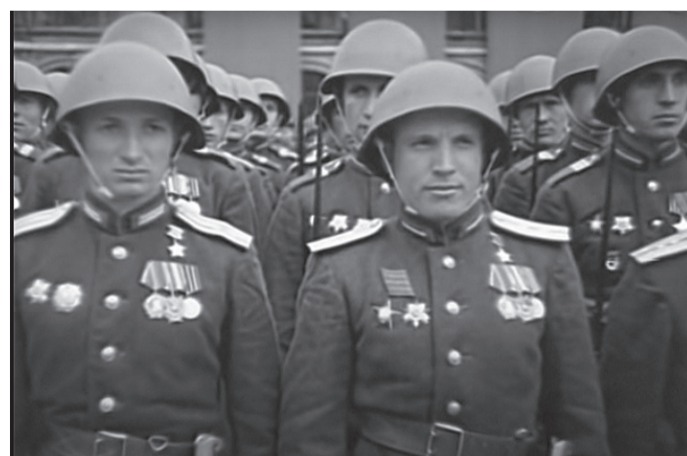
Кадр из фильма «Парад Победы 1945 года».