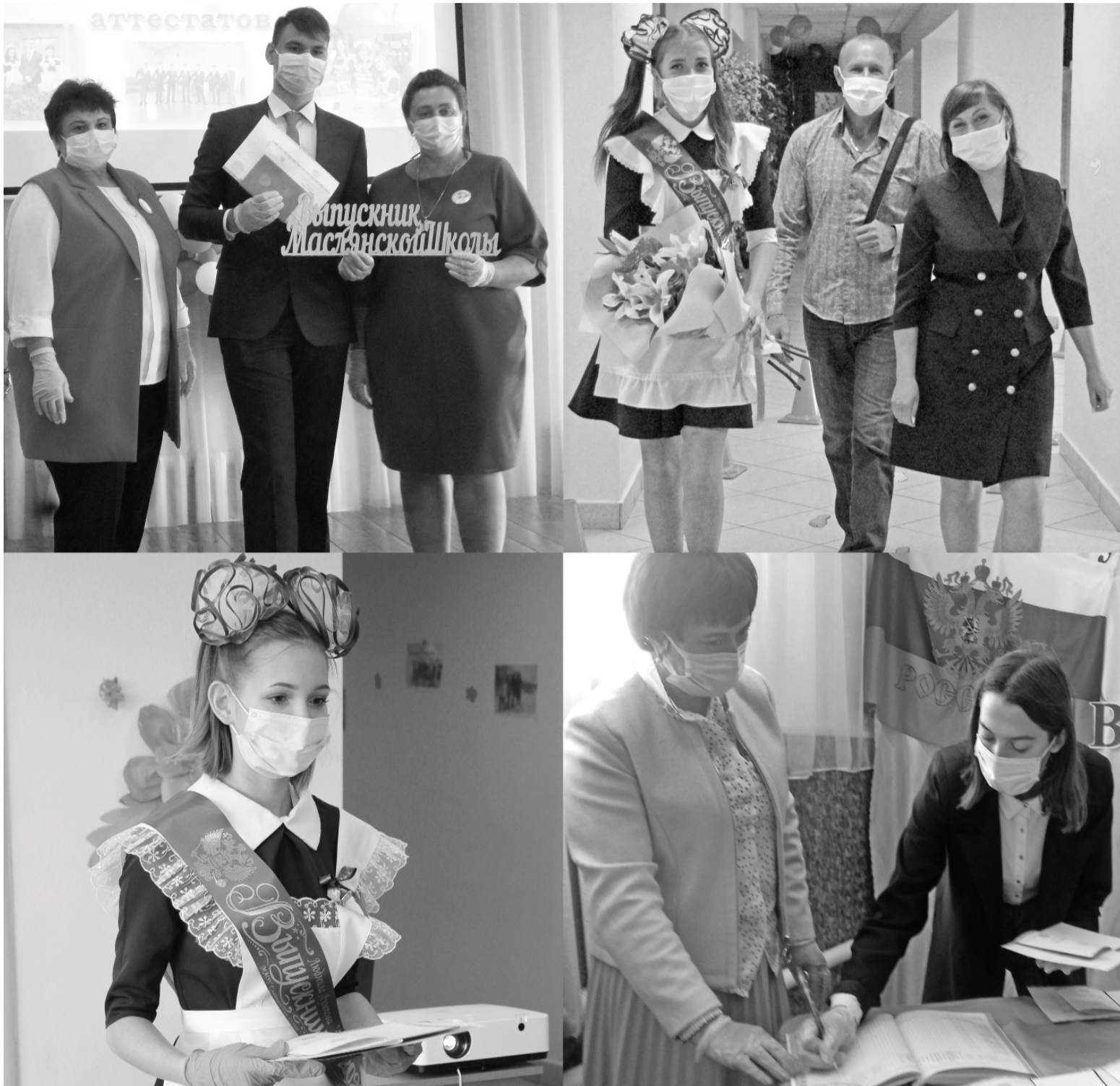
Моменты торжественных церемоний вручения аттестатов.