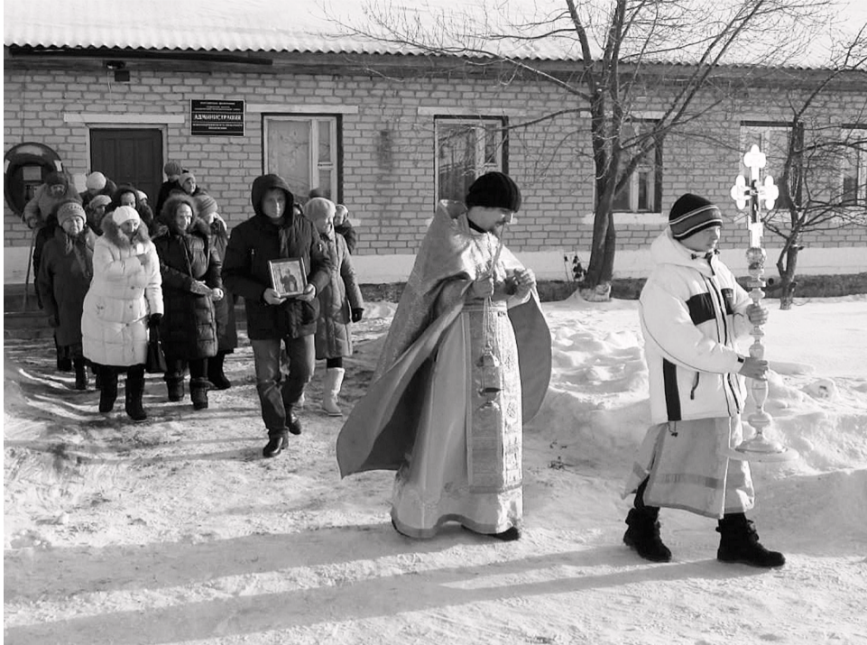
Крестный ход по селу – часть праздничного мероприятия.