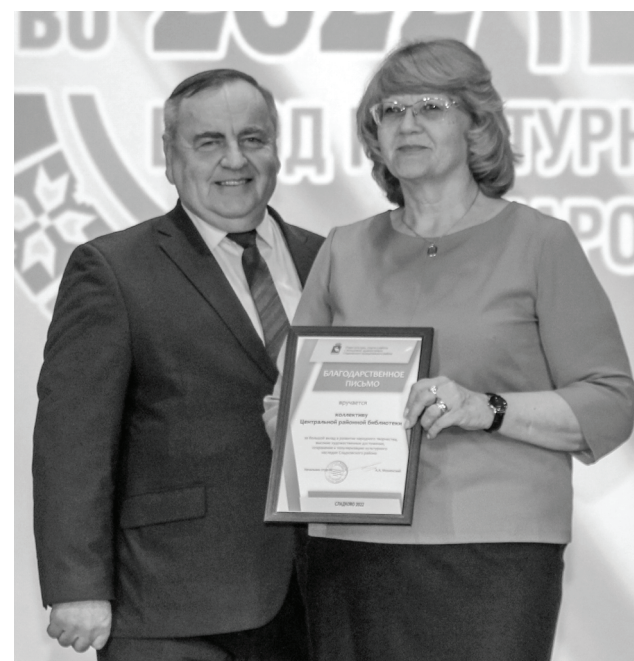
Заслуженные награды на главной сцене муниципалитета получили сладковские самородки.

2022 год прошёл под эгидой Года народного искусства и нематериального культурного наследия народов России , в рамках которого наш район достойно показал себя в региональном и федеральном масштабах.