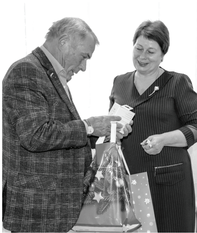
Маслянцам вручили новогодние подарки.