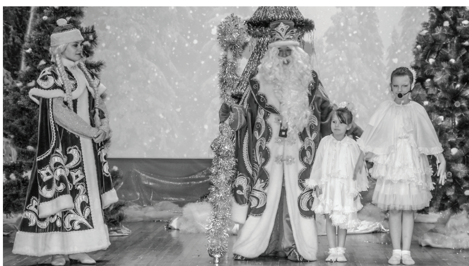
Сказка на сцене.

Для ребят из семей мобилизованных земляков прошёл ряд мероприятий. Восемь школьников посетили Губернаторскую ёлку, приняли участие в развлекательной интерактивной программе, побывали на спектакле, получили сладкие угощения. Районная детская библиотека организовала мастер-класс «Встречаем Новый год», где все желающие изготовили поделку. В виртуальном концертном зале юные читатели по-